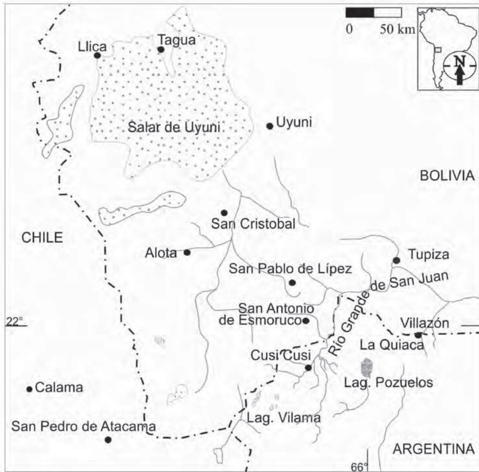
Mapa 2. Región de Lipez, según datos históricos