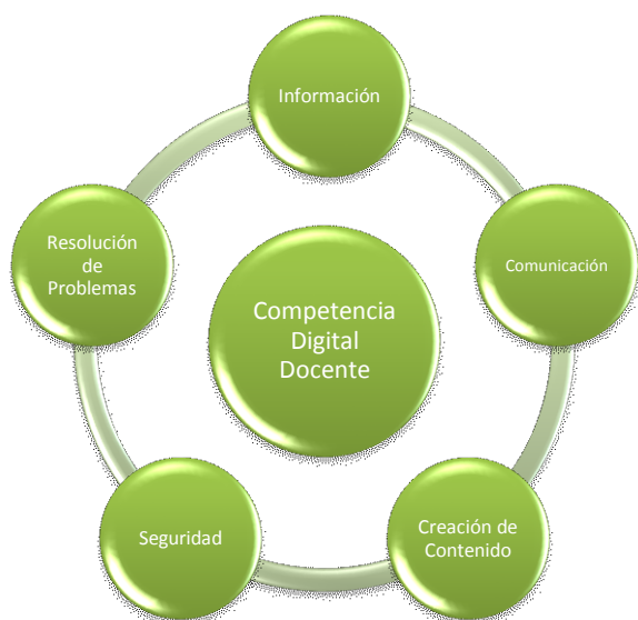
Figura 1: Modelo del Marco Común de la Competencia Digital Docente competencias:

En la Figura 1 se observa este modelo, estructurado en 5 áreas competenciales, las que se abarcan un conjunto de 21