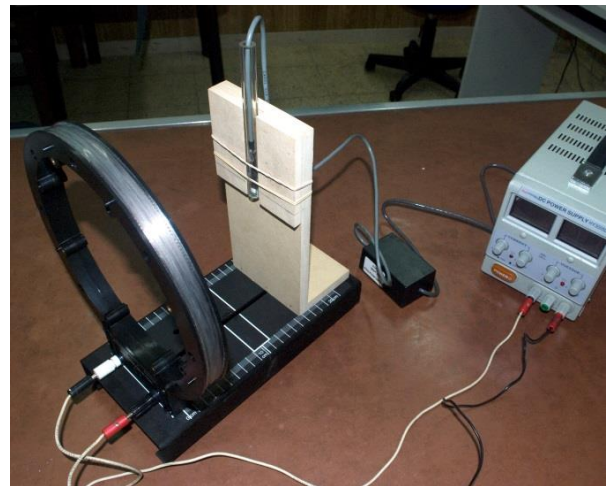
Figura 2. Diseño ingenieril para medición de intensidad de campo magnético producido por una corriente que circula en una bobina, a lo largo del eje.

En el eje de la bobina se ubica la mancha blanca del detector sujeto a un sistema mecánico que permite variar la distancia a la bobina. Se acopla el detector a una interfaz y ésta a una computadora con el programa de procesamiento de datos. En la Fig. 2 se muestra el correspondiente diseño ingenieril para el desarrollo de la experiencia.