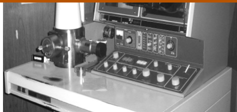
1 Microscopio electrónico de barrido.

El MEB tiene innumerables aplicaciones. A modo de ejemplo, se muestran imágenes del fitoplancton, conjunto de