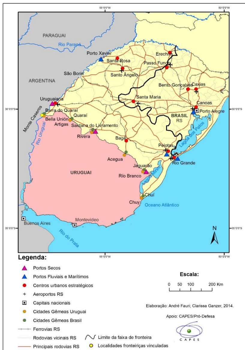
Fig. 1: Principais centros urbanos na rede urbana e infraestrutura de mobilidade no RS. Autoria: Elaborado por Ganzer, C. e Fauri, A., 2014.

fronteira e que possuem população acima de mil habitantes são 14, sendo que, destes, oito contém cidades gêmeas. Há quatro cidades com população acima de 100 mil habitantes, sendo Pelotas a mais populosa (328.275 habitantes), seguida de Rio Grande, importante centro portuário do Estado. Estas duas cidades constituem uma aglomeração urbana importante na porção sul do Rio Grande do Sul, estabelecendo-se historicamente como polos urbanos estruturadores na organização do território fronteiriço, na oferta de serviços como educação e no desenvolvimento econômico do Estado. Estes centros urbanos estratégicos são, portanto, difusores e atratores de dinâmicas urbanas e regionais, com forte relação com a faixa de fronteira em termos de fluxos, permeabilidade e articulações com outros centros. A Figura 1 apresenta a rede urbana do Rio Grande do Sul, sendo elaborada a partir de dois mapas: as Redes Modais disponível no Atlas Socioeconômico do Rio Grande do Sul (2014), que considera as principais rodovias, ferrovias, hidrovias, portos e aeroportos como base de sistema viário do Estado; e Departamento Nacional de Infraestrutura de Transportes (DNIT), que apresenta os postos de contagem (parados e ativos) em rodovias do Estado para marcação de rodovias principais.