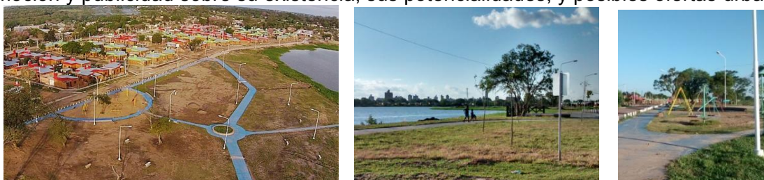
Fig 10 y 11. Parque Urbano Laguna Prosperidad. Imagen aérea de Fb: Resistencia desde el aire; y Fotos: E. Ledesma,03/2015