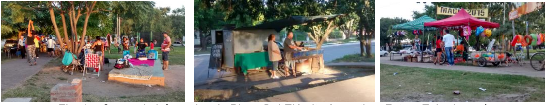
Fig. 14. Comercio informal en la Plaza Del Ejército Argentino. Fotos: E. Ledesma}

Como reflexión final podemos indicar que las plazas y parques estudiados en la AUDC Golf Club, presentan las características de las unidades socioespaciales homogéneas que integran. En general, en lugar de funcionar como espacios de articulación y de atracción entre distintos barrios, son espacios usados fundamentalmente por sus propios habitantes. En ellos se replican las diferenciaciones sociales y se cristalizan las desigualdades que caracterizan este tipo de áreas. Sin embargo, es posible destacar dos cuestiones importantes: intervenciones como la desarrollada en el Parque Urbano Laguna Prosperidad demuestran el enorme potencial de los espacios públicos para producir cambios cuando hay proyectos que van más allá de un plan sectorial. En el extremo opuesto, es posible constatar la capacidad de congregación de vecinos diferentes que tiene un espacio público bien localizado, visible y con buena accesibilidad aún cuando carezca de las más elementales dotaciones como la Plaza del Ejército.