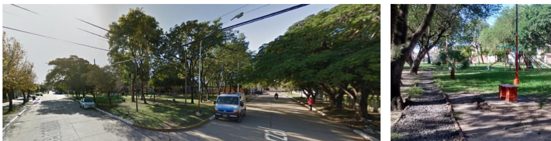
Fig 6 y 7 Plazoleta Barrio Mercantil. Imagen Izq: captura de googlestreetview.com Dcha: Foto de E. Ledesma 09/2014

de una de sus calles laterales (la que linda con la manzana vallada) utilizada para depósito de residuos por parte de los vecinos.