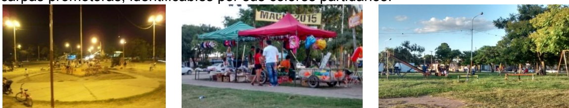
Fig 3, 4 y 5. Plaza del Ejercito Argentino . Fotos: E. Ledesma 03/2015

Existen expresiones religiosas que se disponen al fondo de la plaza en forma de dos altares urbanos. A pesar de las falencias y carencias señaladas, la plaza tiene una concurrencia constante y es utilizada masivamente los fines de semana. Sus espacios libres desprovistos, son aprovechados para realizar deportes y para improvisar canchas. En ella se desarrolla un variado comercio informal de ropa usada, silletas, juguetes, comidas, bebidas y servicios de juegos inflables para niños. Esta actividad comercial, contribuye a la atracción que ofrece la plaza como espacio de entretenimiento. La alta visibilidad y concurrencia de la plaza es aprovechada para propaganda político partidaria, en general los domingos se instalan carpas promotoras, identificables por sus colores partidarios.