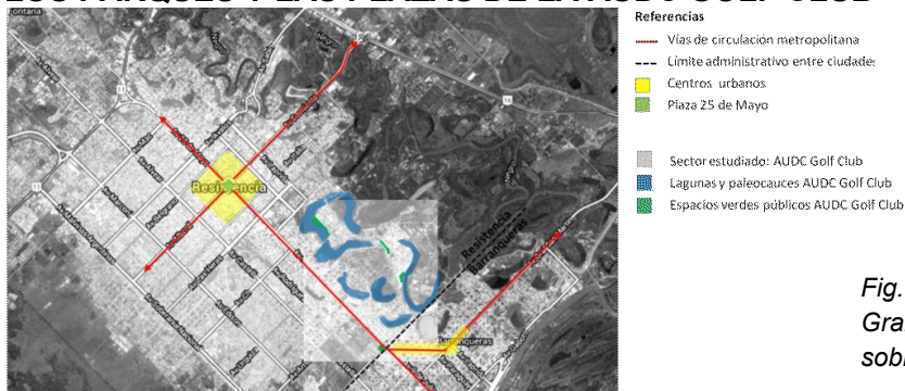
Fig. 1 AUDC Golf Club en relación al Gran Resistencia