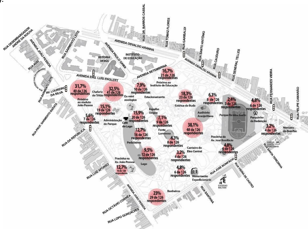
Fig. 4. Mapa dos locais considerados inseguros no interior do Parque Farroupilha

“próximo ao viaduto da Av. João Pessoa” do total de 31,7% dos respondentes, a maioria que considera inseguro pertence ao grupo dos usuários (44,4% - 24 de 54); para a localização “banheiros” do total de 23% dos respondentes, o grupo que menos avaliou como inseguro foi o grupo dos comerciantes (12% - 6 de 50); para a localização “próximo ao Instituto de Educação” do total de 16,7% dos respondentes, o grupo que menos avaliou como inseguro foi o grupo dos comerciantes (4% - 2 de 50) e; para a localização “orquidário” do total de 15,1% dos respondentes, o grupo que mais avaliou como inseguro foi o grupo dos usuários (24,1% - 12 de 54). Embora não tenha sido encontrada uma relação estatisticamente significativa entre os três grupos, o local mais mencionado como inseguro pela maioria dos respondentes foi “fundos do Araújo Viana” (38,1% - 48 de 126), cujas razões mencionadas para esta avaliação são: a presença de tráfego de drogas e baixo movimento de pedestres (Fig. 4).