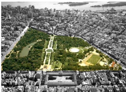
Fig.1. Vista aérea do Parque Farroupilha

Conforme os objetivos deste trabalho foi realizado um estudo no Parque Farroupilha (popularmente conhecido como Parque da Redenção), um parque público não cercado com área de 37,51 hectares, localizado no Bairro Farroupilha em Porto Alegre (Fig. 1 e 2). O Parque Farroupilha é frequentado por uma população significativa de usuários, sendo que nos finais de semana há maior movimentação, possivelmente em função de dois eventos tradicionais na cidade: a Feira Ecológica, que ocorre aos sábados pela manhã, e o Brique da Redenção, aos domingos. Cerca de cinco mil pessoas frequentam diariamente o Parque Farroupilha de segunda a sexta-feira, e, cerca de trezentas mil pessoas durante os finais de semana (Bochiet al. , 2012).