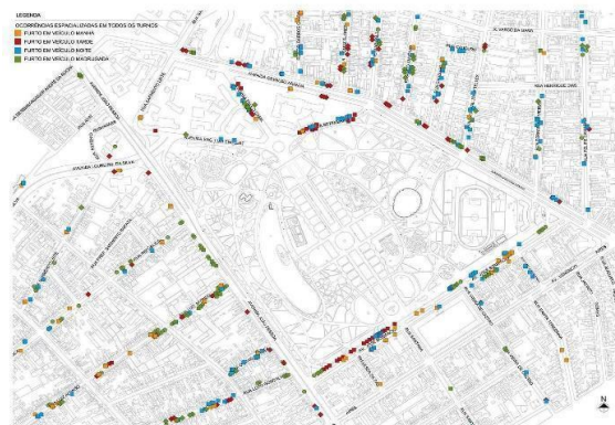
Fig. 6. Espacialização dos furtos em veículo