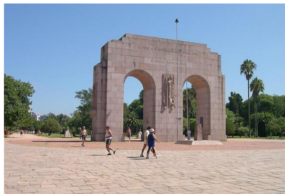
Fig. 2. Monumento ao Expedicionário