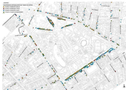
Fig. 8. Espacialização dos roubos a pedestre

Os cálculos das taxas de ocorrências criminais nas ruas adjacentes e proximidades do parque indicam que as maiores taxas de crimes por metro linear são coincidentes com ruas que possuem somente uma face edificada, ao contrário das ruas que chegam até o entorno do parque, que possuem edificações nos dois lados da rua (Tabela 8), sustentando as análises anteriores e corroborando as citações de Jacobs (2000) de que quanto maior o número de edificações voltadas para a via pública, mais segura ela se torna, uma vez que haverá maior possibilidade de supervisão da mesma pelos indivíduos.