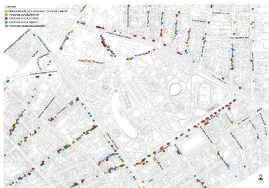
Fig. 5. Espacialização dos furtos de veículo

Notas: SSP=Secretaria de Segurança Pública; (PF)=ocorrências no interior do Parque Farroupilha; (RA)= ocorrências nas ruas adjacentes; (P)= ocorrências nas proximidades do parque.