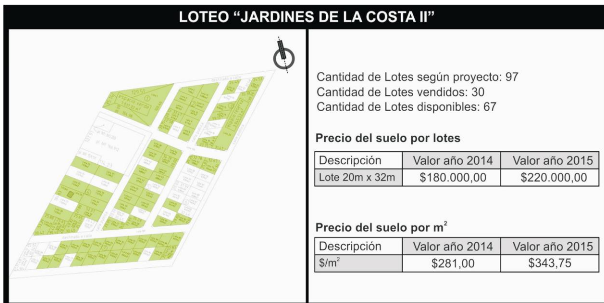
Figura 6. Caso: Urbanización Jardines de la Costa II , y evolución de los valores del suelo. Elaboración propia. Fuente: Sitio web del emprendimiento y datos inmobiliarios.

Menos de la mitad de las viviendas existentes se encontraba ocupada en 2010, según registros del Censo sólo el 46,90% estaba ocupada, cifra que indicaba ser localidad de residencia finisemanal. Coincidentemente, para un total de 899 hogares registrados, se censaron 1.868 viviendas (2,07 viv/hogar). Esta última situación ha sido revertida en un contexto definido por políticas públicas (2012-2015) orientadas al desarrollo de la vivienda individual a través del Programa de Crédito Argentino del Bicentenario para la Vivienda Única Familiar ProCreAr, modificando los datos censales 2010 aunque los registros todavía sean parciales para dimensionar estadísticamente. “ El boom de Arroyo Leyes ” es uno de los subtítulos que utiliza la publicación del periódico local (El Litoral, 2015) para enfatizar que el 79,7% del total de las viviendas construidas desde junio del año 2012 a febrero de 2015 se hicieron a través de la operatoria ProCreAr (377 unidades sobre un total de 473 viviendas).