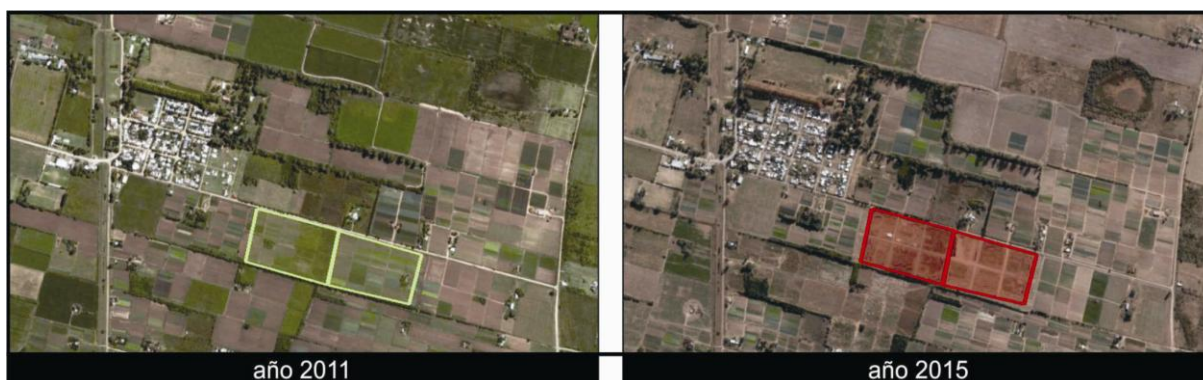
Figura 4: Paraje Ángel Gallardo. Evolución nuevos territorios urbanizados sobre áreas productivas. Referencias: color rojo urbanizado y color verde productivo. Elaboración propia. Fuente: Google Earth.

Las transformaciones en la última década han generado problemas de planificación no abordados. La actual urbanización es dispersa, pero se atomiza más con las últimas intervenciones.