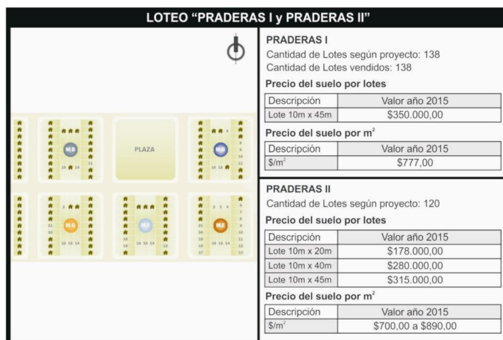
Figura 2. Caso: Urbanización 2014/2015 en el paraje Ángel Gallardo. Esquema del loteo Praderas 1 , y evolución de los valores del suelo. Elaboración propia.

Si bien en los últimos años han ido surgiendo nuevas áreas residenciales instaladas de forma aislada, esta configuración no hace más que seguir una tendencia de origen, vinculada tanto al sistema ferroviario que con sus parajes propició el desarrollo de pequeños núcleos residenciales a lo largo de su trayecto en el territorio, como así también la utilización de los bordes costeros como áreas recreativas y productivas. Ambas posiciones contribuyeron a una particular configuración del distrito Monte Vera, donde la fragmentación y dispersión han caracterizado la urbanización del área, dentro de estos contexto el emprendimiento inmobiliario Praderas 1 y Praderas 2 dentro del paraje "Ángel Gallardo" se instalan como ampliación de de este núcleo en el extremo Sureste, sobre el viario que conecta con el paraje "El Chaquito" y "La Costa", modificando 7 ha. de suelo productivo, la nueva urbanización se subdivide en 114 lotes (10m x 30m) y se ofrece a nivel publicitario como un barrio residencial abierto, vinculado a la naturaleza a una corta distancia de la ciudad central.