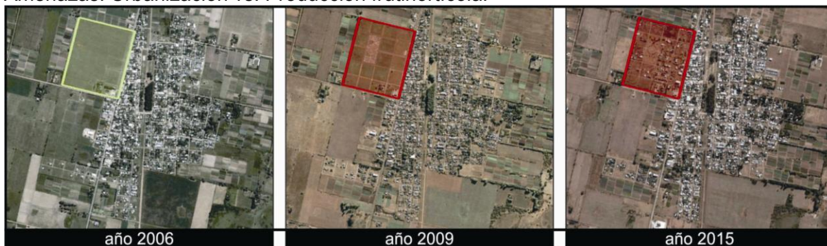
Figura 3: Monte Vera. Evolución nuevos territorios urbanizados sobre áreas productivas. Referencias: color rojo urbanizado y color verde productivo. Elaboración propia. Fuente: Google Earth.