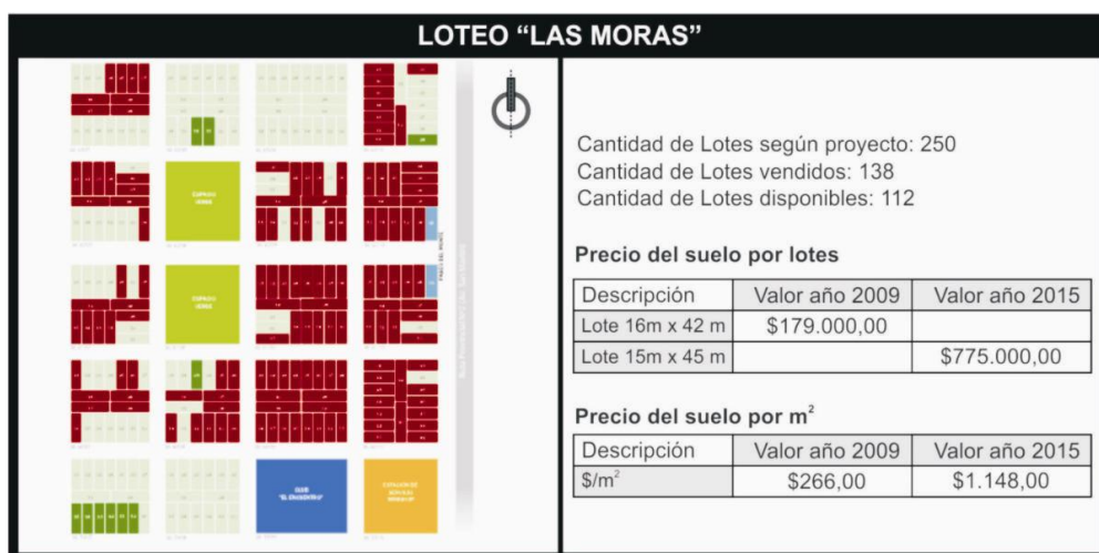
Figura 1. Caso: Urbanización 2008 en el centro de la localidad. Esquema Urbanización Las Moras , y evolución de los valores del suelo. Elaboración propia. Fuente: Sitio web del emprendimiento y datos inmobiliarios.

En Monte Vera, la instalación de equipamientos industriales y logísticos sobre la Ruta Provincial Nº 2 están configurando en los últimos años una incipiente área especializada hacia el sur del distrito, límite de mayor cercanía con Santa Fe, potenciada por la conexión entre ambas localidades. Se agrega también sobre este viario una nueva área residencial conocida como el Loteo Las Moras , que desde su lanzamiento en el año 2008 ha instalado 250 lotes de grandes dimensiones (15 m x 45 m.), con áreas verdes y comerciales que expanden el histórico núcleo urbano y consolidan la centralidad de la comuna.