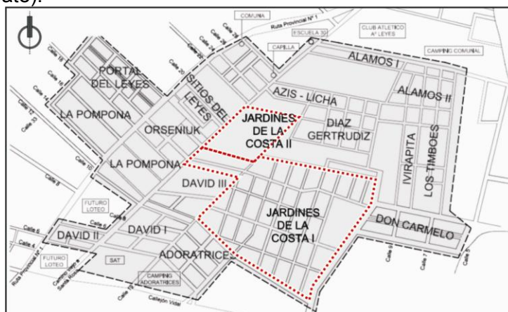
Figura 8. Esquema del servicio de gas natural proyectado.

Es de destacar el proyecto para la ejecución de una red de desagües cloacales, que la comuna ofrece por contribución de mejoras en tres etapas, servicio primario para el desarrollo (en debate).