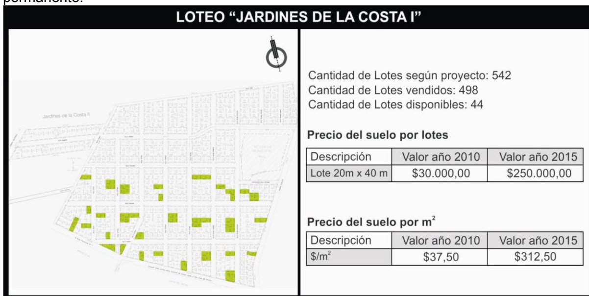
Figura 5. Caso: Urbanización Jardines de la Costa I , y evolución de los valores del suelo. Elaboración propia. Fuente: Sitio web del emprendimiento y datos inmobiliarios.

Periferia residencial relacionada con la idea de barrio jardín. Espacio históricamente productivo que paulatinamente ha ido cambiando su identidad a partir de un proceso de suburbanización hacia la dirección Este, cuya dinámica absorbe la demanda residencial de la ciudad de Santa Fe. La construcción de las defensas contra inundaciones (1992) motorizó el cambio de uso que se consolidó a través del tiempo: primero con la emergencia de residencias finisemanales complementariamente con grandes usos parcelarios destinados a la recreación y el deportes (clubes, etc); luego a través de emprendimientos turísticos vinculados al paisaje ribereño; y finalmente, con nuevas urbanizaciones y loteos de grandes fragmentos que revierten la anterior tendencia respondiendo a requerimientos de residencia permanente.