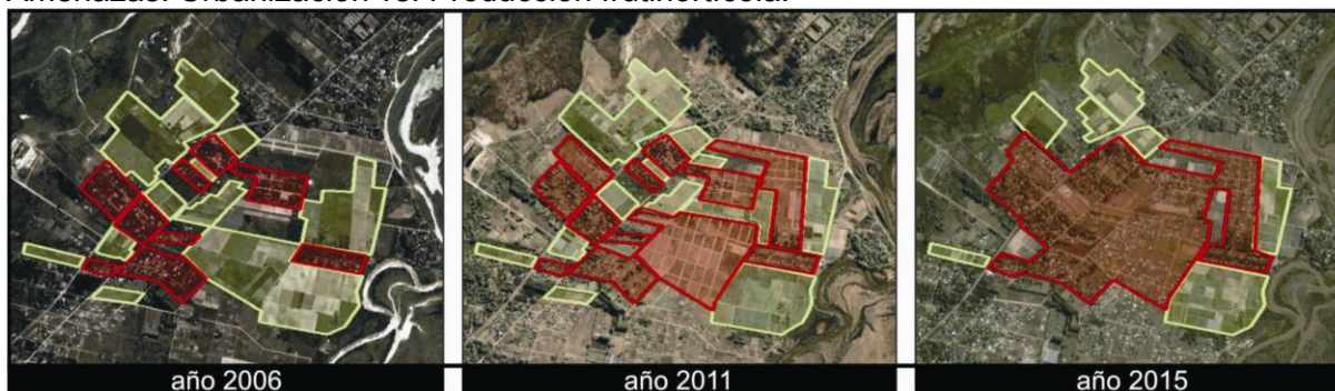
Figura 7: Arroyo Leyes. Evolución nuevos territorios urbanizados sobre áreas productivas. Referencias: color rojo urbanizado y color verde productivo. Elaboración propia. Fuente: Google Earth.

Amenazas. Urbanización vs. Producción frutihortícola.