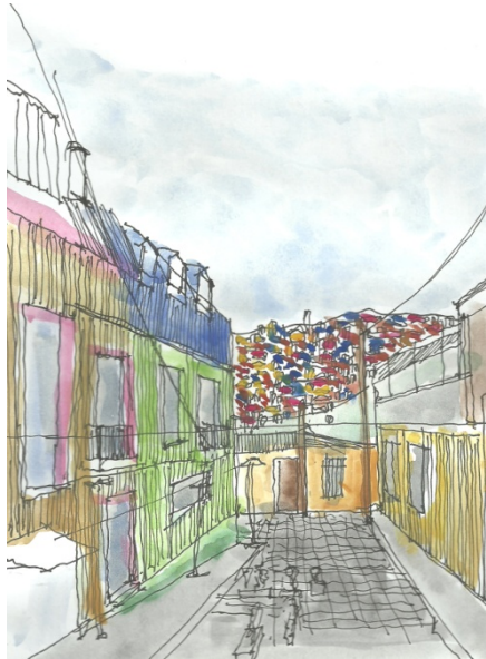
Fig.9- Pasaje urbano de Valparaíso. Schlieper

espacio de la cultura plural comunica su opción, su apertura a la expresión de las diferencias, las singularidades por medio del color.