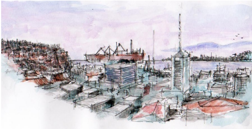
Fig.6- Panorámica Valparaíso. Franchina.