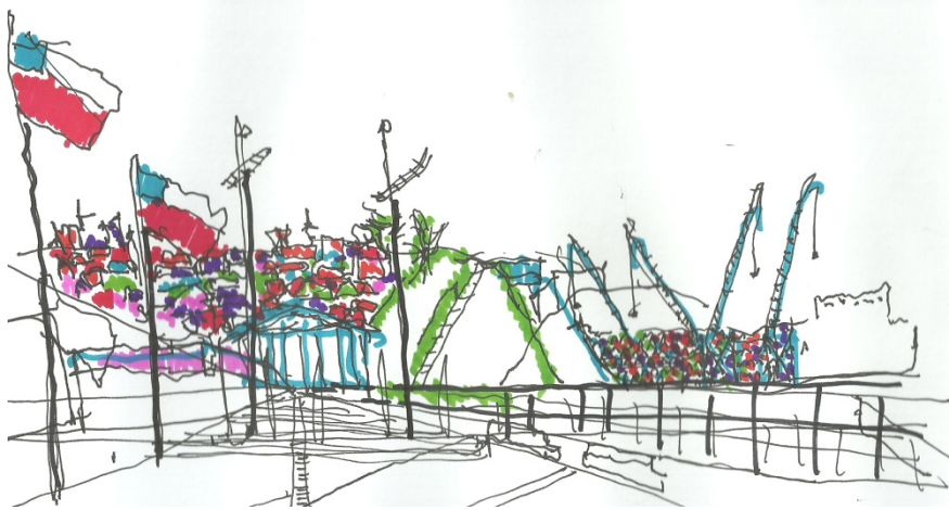
Fig.6- Puerto de Valparaíso; paseo costanera. Schlieper.