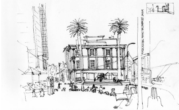
Fig.3- Plaza Anibal Pinto-Valparaíso. Gattari.