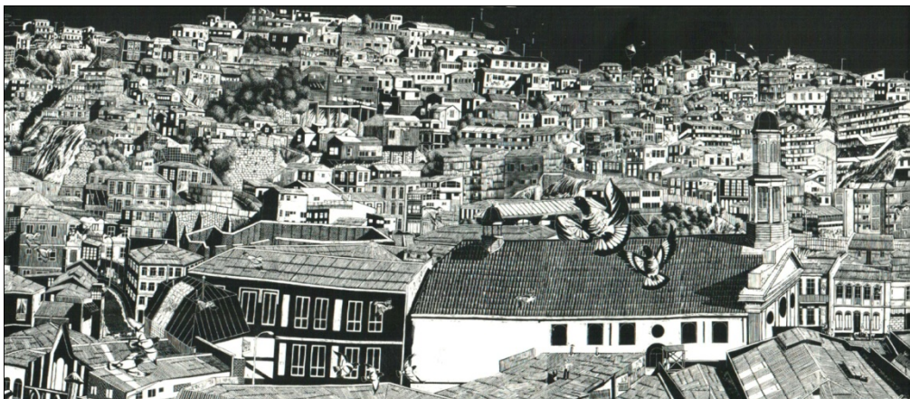
Fig.11- Loro Coirón Desde el cerro Cordillera. Los cerros: Toro, Santo Domingo, Arrayan, Playa Ancha, Artillería, componentes de la corona del Barrio Puerto. Detalle mural linografía.

Estas prácticas gráficas en Valparaíso ofrecieron la posibilidad de producir diferentes registros sobre el espacio urbano y así explorar en esta ciudad diferentes situaciones espaciales desde distintos puntos de vista y alturas de horizontes.