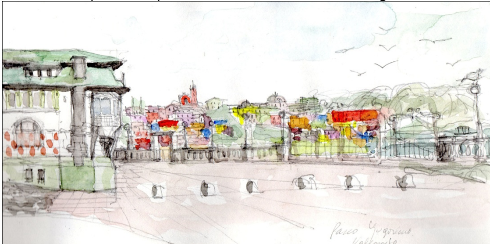
Fig.5- Palacio Barburizza, balcón urbano-mirador Cerro Alegre. Arq. Gamboa.

La síntesis intelectual, las ideas proyectuales se producen desde la percepción de lo real del mundo descrito en un proceso hacia "lo irreal" de la imagen mental, la interpretación.