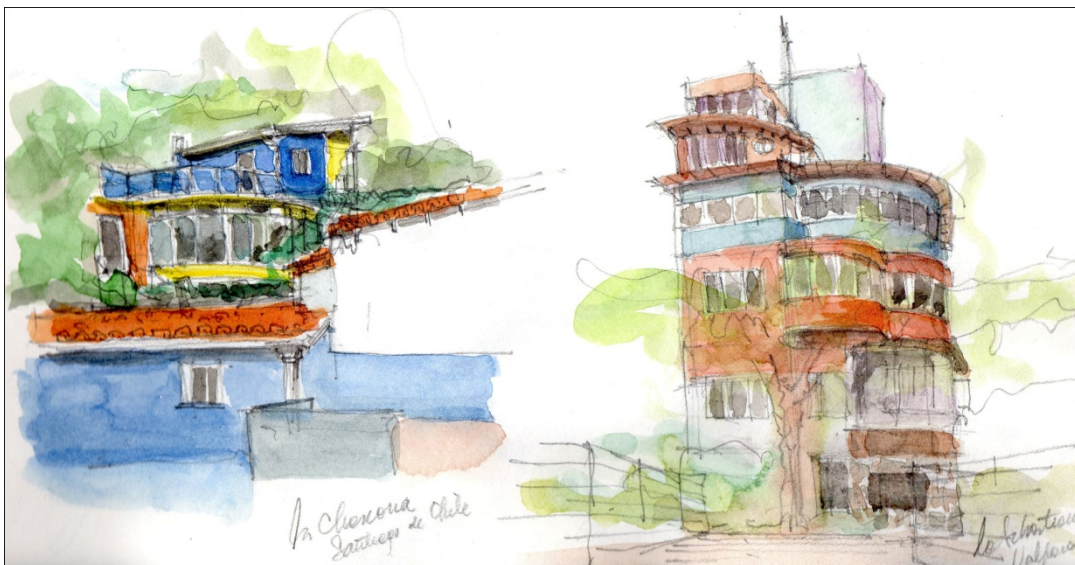
Fig.2 Casas de Neruda: La Chascona, en Santiago y La Sebastiana en Valparaíso. Arq.Gamboa

Los trabajos de campo, croquis urbanos con asistencia de los docentes se inician el día 21 de septiembre de 2014 en la ciudad de Merlo tomando como objeto de estudio la Plaza Sobremonte y la Capilla Nuestra Señora del Rosario de Piedra Blanca (1737-1740), Monumento Histórico Nacional.