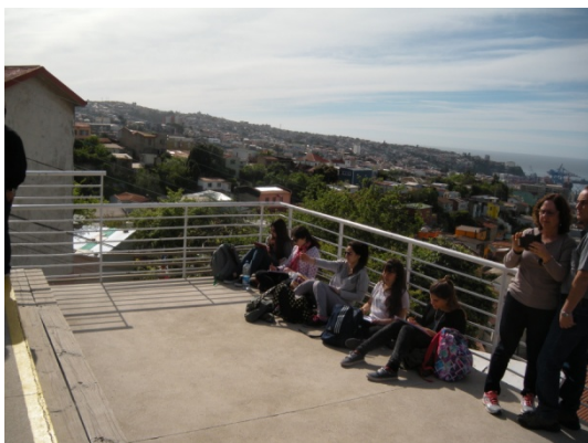
Fig.7 - Dibujando en la Sebastiana