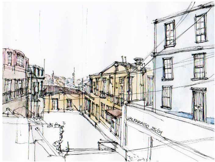
Fig.10-Abra Valparaíso- Gattari

Haciendo posible expresar el paisaje urbano de los cerros por medio de la yuxtaposición de puntos y o manchas de color, como una aproximación didáctica a la síntesis.