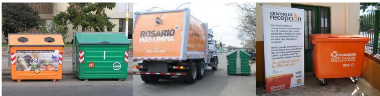
Fig. 1, 2 y 3 Sistema de separación y recolección de residuos

Este problema se agrava de forma constante por el gran crecimiento habitacional y desarrollo productivo a nivel regional que tiene la ciudad de Rosario y su área metropolitana. Ante esta situación, la Municipalidad de Rosario, cuenta con el sistema de recolección general de RSU y con el programa SEPARE promoviendo ante la población la concientización de separar los residuos en origen y sosteniendo con diferentes acciones los emprendimientos de recuperadores y clasificadores. Así se obtienen grandes volúmenes de residuos reciclables secos entre los cuales se encuentran los plásticos.