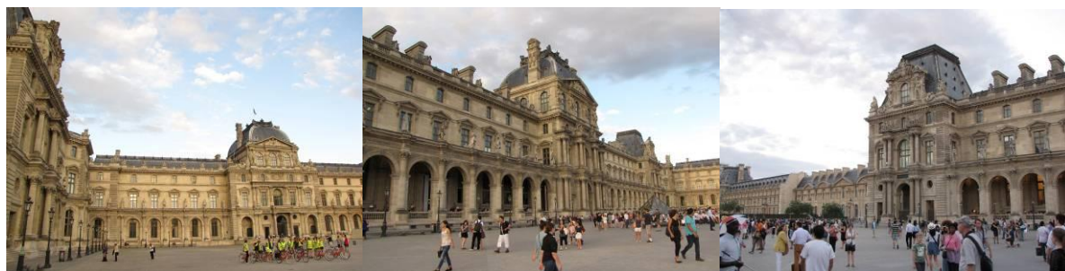
Fig. 4 Vistas do Museu do Louvre sem a Pirâmide na 'Cour Napoléon'