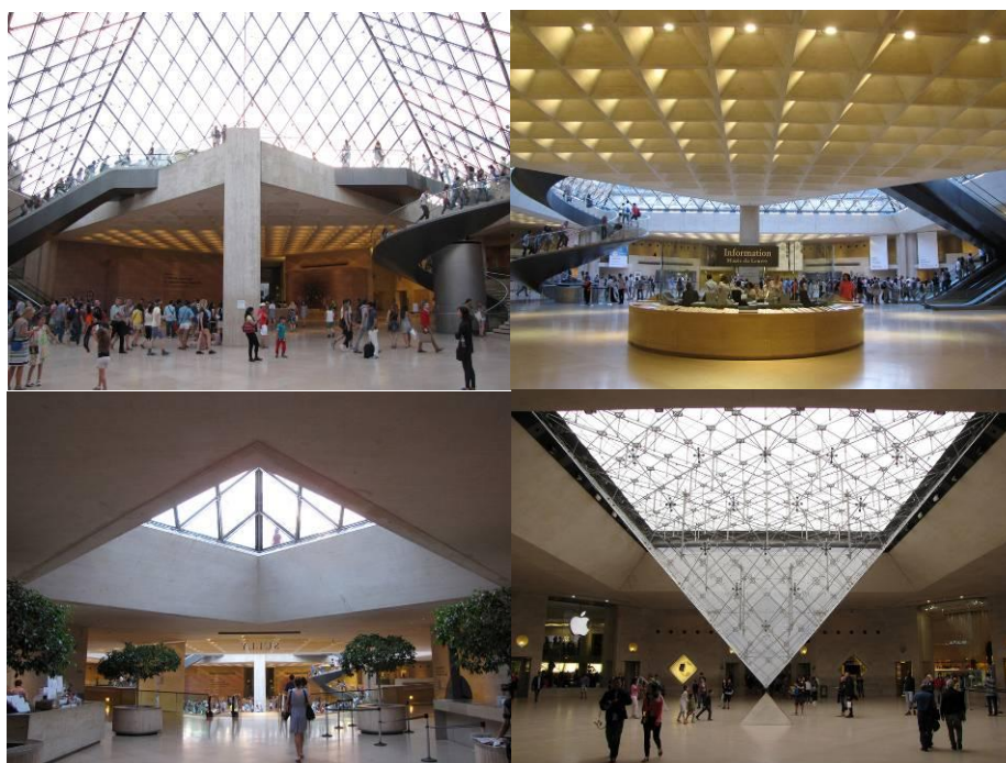
Fig. 3 Vistas do interior do 'Le Grand Louvre'

A qualidade estética do espaço interno também está em conformidade com a ideia de que uma tarefa fundamental de um museu está em estimular e afinar a sensibilidade de seus usuários (p.ex., Lebmbruck, 2001). Assim, salienta-se a qualidade estética dos espaços no sub-solo caracterizados pela unidade de cores e texturas dos materiais utilizados, assim como pelo alto nível de detalhamento e acabamento. Ainda, as três pirâmides menores enriquecerem a experiência arquitetônica no interior do 'Le Grand Louvre', possibilitando vistas para o exterior, e a marcação dos caminhos a partir da recepção para as três diferentes galerias do Museu, nomeadamente, Denon, Richelieu e Sully. Kimball (1989, p.60) salienta que 'Pei brilhantemente posicionou estas pequenas pirâmides de maneira que o visitante possa imediatamente se orientar em relação à parte do museu que ele deseja ver.'