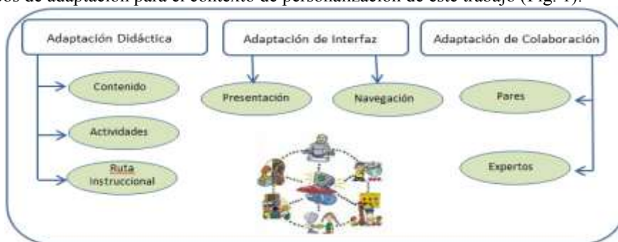
Figura 1: Tipos de adaptación

A partir de considerar diferentes aproximaciones teóricas [2, 3, 6, 9] respecto a los tipos de adaptación o personalización en e-learning, hemos determinado los siguientes tipos de adaptación para el contexto de personalización de este trabajo (Fig. 1).