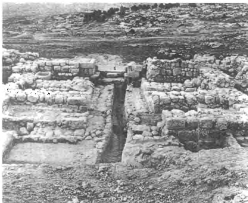
Excavaciones en Gezer, Israel.

aspectos de la vida diaria de los franceses. Donde era posible se acentuaba el derecho natural por encima de los privilegios en boga para un círculo reducido de personas. Una de las innovaciones descollantes que destacaba el vínculo del hombre con la naturaleza, fue la puesta en vigencia de un nuevo calendario, proceso cuya instrumentación la Convención Nacional encargó al presidente del Comité de Instrucción Pública, Ch. G. Romme. Este funcionario confió el estudio técnico de la empresa a un grupo de matemáticos, entre ellos a Monge y Lagrange. El 5 de octubre de 1793 entró en vigencia este calendario con la aclaración de que la Nueva Era había comenzado el 22 de septiembre de 1792, día de la proclamación de la República. En ese día el Sol pasa por el equinoccio de otoño, hecho simbólico que destacaba que un importante fenómeno celeste coincidía con un importante hecho histórico: el nacimiento de la República. Según este calendario, el año empezaba en septiembre en el día del equinoccio de otoño y constaba al igual que el Gregoriano de 12 meses pero de igual duración, 30 días, más cinco días conocidos como