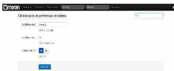
Fig. 4 – Configuración de OAI-PMH en Meran

Actualmente, desde cualquier Meran es posible consultar la interfaz de OAI. Por ejemplo en la Facultad de Ciencias Económicas, la URL es http://catalogo.econo.unlp.edu.ar/oai?verb=ListRecords&metadataPrefix=oai_dc