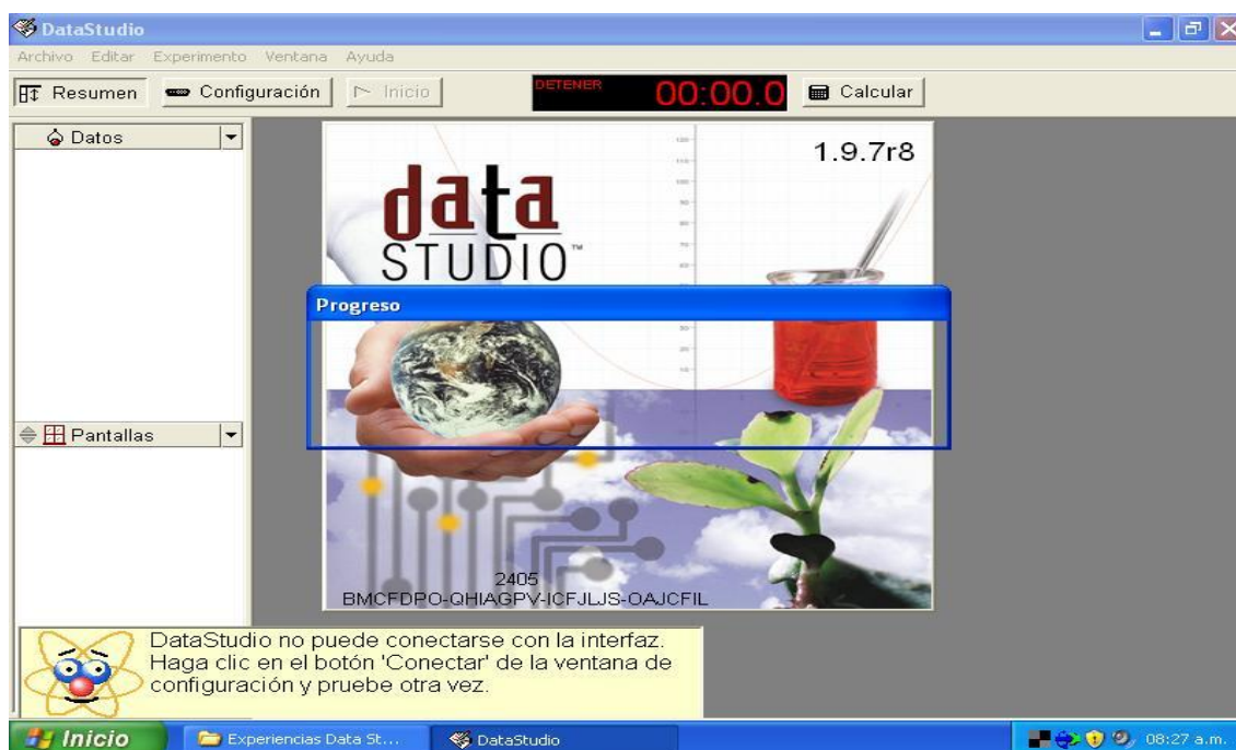
Fig. 2: inicio del software Data Studio

En la figura 2 se puede observar el inicio del software Data Studio, posteriormente se configura el gráfico con los ejes necesarios para cada experiencia, en este caso se usó la absorbancia y el tiempo.