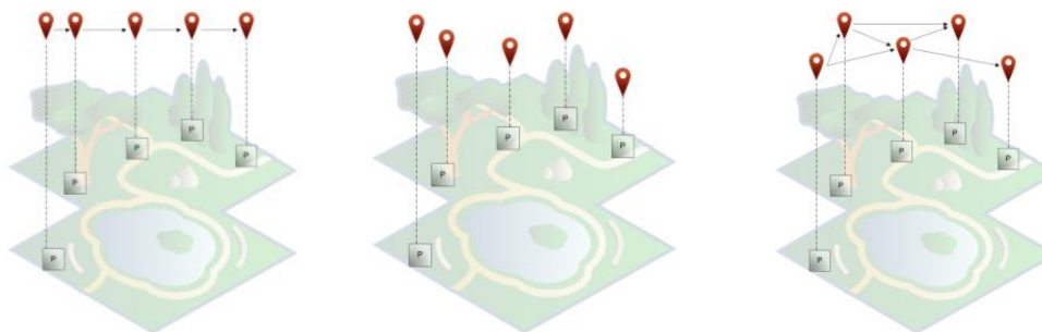
Figura 3: Relación entre el contenido estructurado y posiciones en el espacio de juego.

Otra actividad en común para ambas opciones de creación propuesta en la Guía es, por parte de los expertos en educación, la elección del espacio de juego, para luego, realizar una representación de dicho espacio (por ejemplo, un dibujo esquemático del lugar) e indicar cada uno de las posiciones destacadas en las que se brindará contenido educativo (esto forma parte de la capa de movilidad que luego será implementada por los tecnólogos). En la capa de movilidad, se deberán contemplar las características relacionadas con la movilidad del usuario, como por ejemplo, implementar el mecanismo de sensado de posicionamiento. La Figura 3, muestra tres ejemplos con las posibles estructuraciones de contenido, propuestas previamente, relacionadas con posiciones en un espacio de juego.