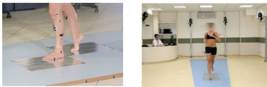
Figura 3. Registro de la pisada y registro en video de la marcha

Registro de Video, Imágenes y Pisada. El paciente camina mientras se lo filma con un conjunto de cámaras de video (entre 4 y 8 cámaras) de alta velocidad (30 a 240 cuadros por segundo) desde distintos planos que registran el movimiento de los marcadores. Al pisar la placa sensible se envía información de la pisada. Un sistema de registro de video permite captar imágenes de frente y de perfil y realizar una observación y estudio en cámara lenta y de forma repetida tantas veces como sea necesario. Asimismo al obtener un registro objetivo facilita poder valorar y comparar a un mismo paciente en diferentes situaciones (p.ej. con o sin ortesis, con o sin uso de ayudas externas) o entre diferentes momentos (p. ej. pre y post intervención o seguimientos periódicos).