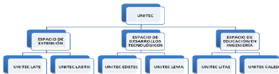
Figura1 Organigrama de la UIDET UNITEC de la FIUNLP

La UIDET UNITEC (Unidad de Investigación, Desarrollo, Extensión y Transferencia para la Calidad de la Educación en Ingeniería con orientación en el uso de TIC) es una unidad de la Facultad de Ingeniería de la Universidad Nacional de La Plata, cuya creación oficial se produce en setiembre de 2009, dedicada fundamentalmente a llevar adelante proyectos de Extensión Universitaria, sin dejar de lado otras actividades como la investigación, transferencia de conocimientos y docencia. Algunos profesionales y alumnos universitarios integrantes de la misma coordinan y dirigen el proyecto del Laboratorio de Marcha de bajo costo para APRILP. Son, fundamentalmente, profesionales y alumnos de la Carrera de Ingeniería Electrónica.