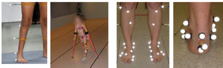
Figura2 Marcadores reflectantes

Preparación del paciente El kinesiólogo adhiere en diferentes puntos clave del cuerpo del paciente marcadores reflectantes que permiten al sistema registrar los movimientos, Figura 2.