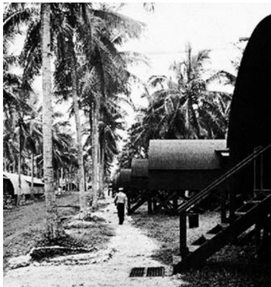
Figura 4. Hospital Naval Nº3, Santo Espiritu. Nueva Zelanda.

Fue en el contexto de este interés por las condiciones de vida en los trópicos expandido por la guerra que la cuestión del tropical housing comenzó a formar parte de la cultura arquitectónica moderna como un nuevo tópico cultural. Dicho de otro modo, la cultura arquitectónica del período de la guerra contribuyó a dar visibilidad, a construir como discurso a la preocupación por la especificidad bioambiental de los trópicos. Y es en este contexto como deben ser entendidos dos conocidos episodios: la actividad de Richard Neutra y Henry Klumb en Puerto Rico y, mucho más altisonante, la de un importante grupo de arquitectos brasileños consagrada en 1943 en la exposición «Brazil Builds» llevada a cabo en enero y febrero de ese año en el MoMA, en colaboración con el American Institute of Architects.