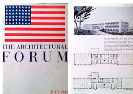
Figuras 3a y 3b. Portada de la Revista Architectural Forum. Barracas para soldados instalados en zonas tropicales.

se publicaba un artículo dedicado a « new designs (that) have been worked out in connection with proposed construction for troop housing in tropical and semitropical areas » (Figura 3b), con el propósito de mostrar que « they show how it is possible to meet some of the housing problems confronting the Army in such climates » (Projected Construction, 1942: 38). Entre los autores de los proyectos, que procuraban articular diferentes dispositivos de control climático con un lenguaje modernista, se encontraban oficinas como Shaw, Naess & Murphy y Holabird & Root.