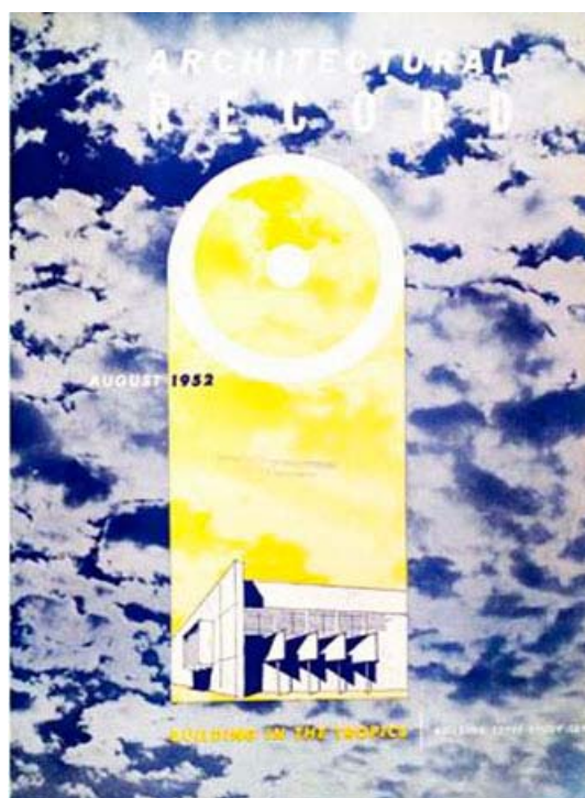
Figura 7. Architectural Record. «Building in the Tropics». Agosto, 1952

Uno de los puntos más importantes de la posición defendida por la revista era el del tipo de tecnologías a ser aplicadas en las áreas tropicales. Se trataba de responder a la pregunta « How far should we follow indigenous buildings as prototypes for our own designs in tropic countries? » (Ibidem), a la cual se respondía que, si bien en esos edificios había enseñanzas de las que aprender, las construcciones indígenas no ofrecían modelos a seguir en los programas modernos. Pero además, siendo que los clientes a los que los arquitectos norteamericanos debían responder eran sus propios compatriotas en esos territorios la expresión debía ser la de una inteligente investigación de las mejores y más avanzadas tecnologías disponibles para esos fines. Después de todo: « under the influence of mass-produced automobiles and household equipment, people now want the comforts that modern industry can give them and they are finding contemporary architecture eminently suitable » (Ibidem, 161).