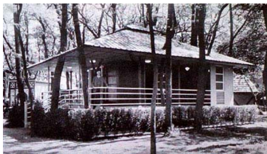
Figura 2. La maison coloniale. Construida por la Industria de Construcciones Modernas para las autoridades de la zona americana del Canal de Panamá. Fuente: Jean Royer (ed.), L'Urbanisme aux colonies et dans les pays tropicaux. París, 1935.

1935:44). A la espera de ese momento había que ejercer la máxima vigilancia higiénica sobre las construcciones indígenas, y en lo posible, acudir a una clara segregación espacial como modo de evitar la «contaminación» física, racial y cultural. 14