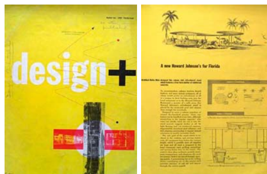
Figura 6. Portada Design + y propuesta del Arq. Rufus Nims para refugio en un club de recreo, desplegando un techo de forma libre en horigón armado.

En el clima de la «fiebre tropical» inspirada en el vigente interés por las fascinantes creaciones provenientes de Brasil, en 1950 se publicó en los Estados Unidos el primer número de Design +. A quarterly magazine of tropical architecture and arts (Figura 6) editada en el estado Florida. La revista presentaba una serie de proyectos ostensiblemente brasileños, mediante lo cual esperaba, por un lado, estimular « the forward-looking manufacturers and suppliers who serve the building business of the tropical southern area », y por otro, promover « the interest of the greatest possible number of people in the building industry of the tropics and its achievements » (1950: 3). Es difícil no percibir el rotundo fracaso de la publicación –solo se publicó ese número– como resultado de una visión exageradamente optimista de una tendencia que se revelaría como una moda pasajera.