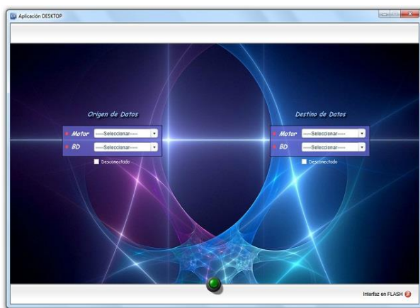
Figura 1. Pantalla de Conexión con Bases de Datos

A continuación se pueden observar algunas de las interfaces principales de la aplicación: