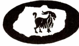
Edgardo-Antonio Vigo, Plástico platense.