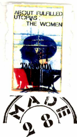
Estampilla "Mujer" y matasello, 1992.

Conocí a Edgardo-Antonio Vigo en la década del '60. Bullian mi cuerpo y La Plata con pintores, galerías, cines y teatreros. Lo vi en un pasillo de Tribunal Civil. Regalaba poemas concretos, fascinantes y misteriosos para mi adolescencia. Pasaron dictaduras y democracias blandas. Sus serigrafías acompañaban EN MARCHA, casi un rito periódico en los escritorios judiciales bonaerenses que obsequiaba la asociación. Arte en el trabajo, el conflicto, la batalla. Arte minúsculo e intersticial en los Palacios de Justicia. Vigo se colaba para estar entre nosotros, como debajo de las rendijas aparecía en las moradas con su arte correo. El Holocausto Nacional lo hirió profundamente y obtuvo un testigo veraz, impertinente, insobornable. Luchó con sus obras. Sembró semillas de papel contra el Olvido. Obras de materiales simples y al alcance. Cartones, maderas, sellos rústicos e impecables, repetibles e inexorablemente únicos fueron sus constantes. Otra la palabra, obra o manifiesto.