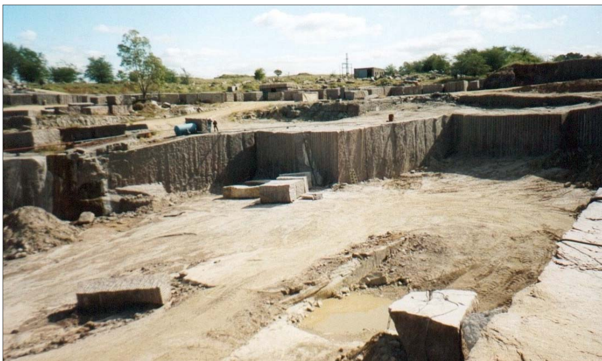
Cantera productora de bloques de granito rojo Sierra Chica

El conocido granito rojo Sierra Chica fue usado en construcciones que hoy forman parte del patrimonio histórico de varias localidades, como la ciudad de Buenos Aires, La Plata y otras en la Argentina, además de algunas obras importantes en capitales europeas (2,3).