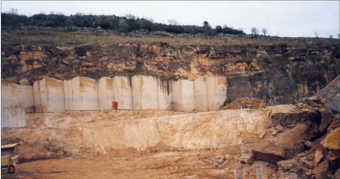
Cantera productora de bloques de dolomías en Sierras Bayas

Dados algunos ejemplos de utilidad de rocas ornamentales bonaerenses, y para concluir, debe destacarse que a lo largo de la historia el uso de la piedra natural en la industria de la construcción ha competido permanentemente con los materiales artificiales, éstos generalmente de menor costo. Sin embargo, en toda época ha sido elegida la piedra para la ejecución de obras de alto valor arquitectónico. Edificios que hoy forman parte del patrimonio histórico - cultural de nuestro país, demuestran sus virtudes al observarse su belleza y su casi perfecto estado de conservación.