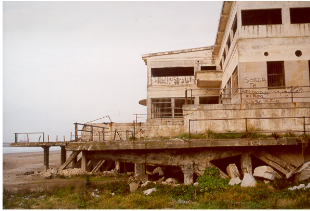
Fot. 4: Vista general. Año 2002