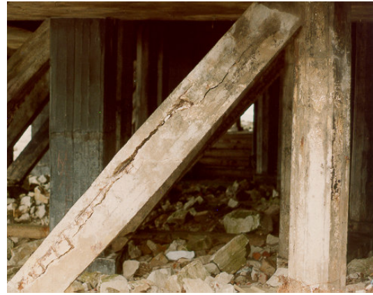
Fot. 3: Infraestructura. Año 1991