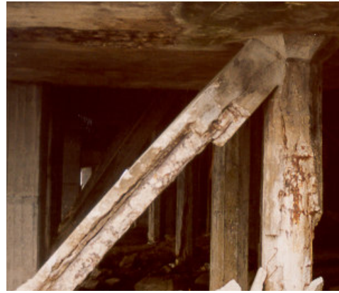
Fot. 5: Infraestructura. Año 2002

Ensayos de laboratorio: Sobre muestras de hormigón extraídas de la estructura, en especial de las columnas de sostén, se realizaron distintos ensayos. En el hormigón de refuerzo ejecutado en 1986 se detecta que los cloruros han penetrado por procesos de difusión hasta las barras de refuerzo en porcentajes elevados que originaron la iniciación y desarrollo de los procesos de corrosión.