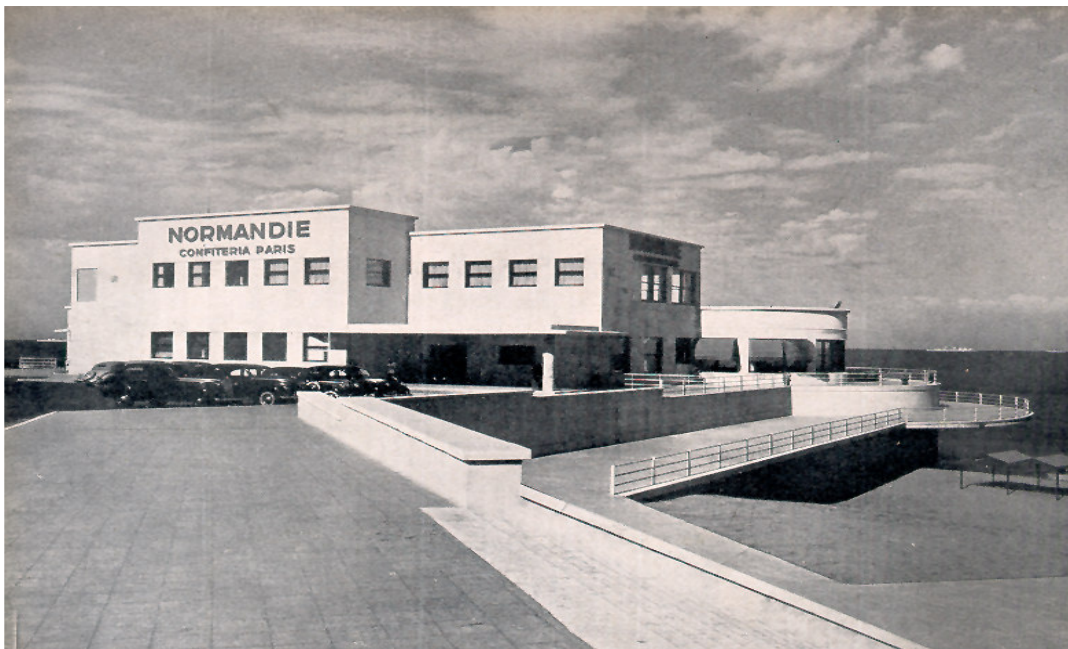
Fotografía 1: Vista del edificio Normandie. Año 1939.

Se debe deducir que el alcanzar el fin de la vida proyectada no implica la demolición de la estructura, sino que el costo del mantenimiento a partir de ese momento se incrementa por encima del que se ha considerado realizar durante la vida proyectada. Solamente en estructuras sin valor patrimonial, arquitectónico o histórico, se plantea en esta circunstancia, la necesidad de su reparación o demolición y reemplazo en función de los costos involucrados. En el caso particular del edificio Normandie, los citados valores aconsejan su reparación y puesta en valor.