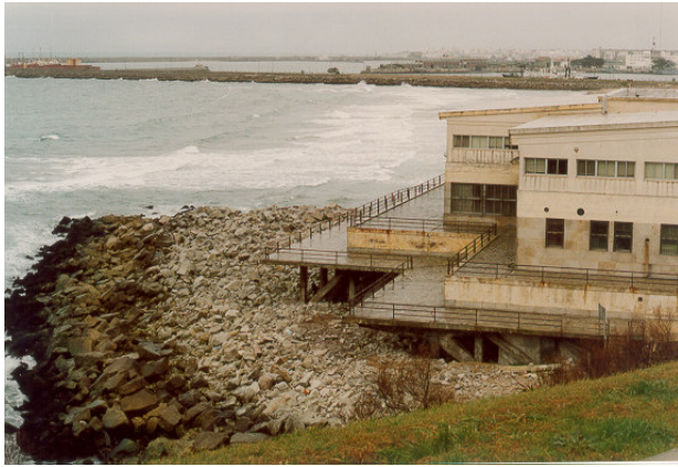
Fot. 2: Vista general. Año 1991.