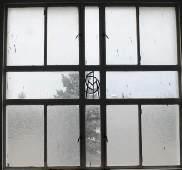
Detalle interior. Ventana art déco.

"Vengo dos o tres veces por año al pueblo. Nunca cambia. Pringles es bastante conservador" CA