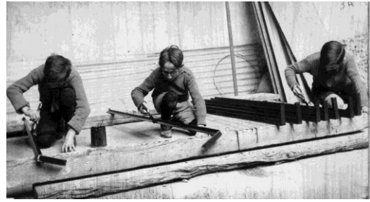
Dando pintura antióxido a las varillas que servirán para armar las claraboyas del techo.