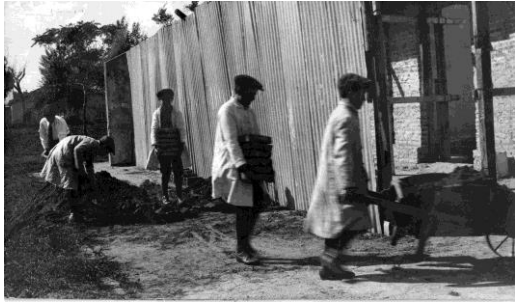
La descarga y transporte de materiales siempre se llevó a cabo con la intervención directa de los alumnos, tal como se habían comprometido.