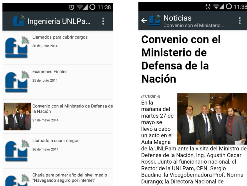
Fig. 2. Capturas de pantalla de la aplicación.

La primera pantalla de la aplicación muestra una lista de noticias (Fig. 2). Cuando el usuario selecciona una noticia, podrá ver todo el contenido de la noticia (texto, imágenes y links).