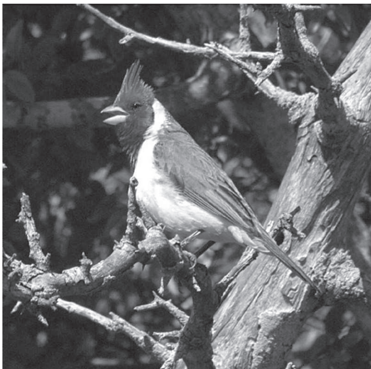
Fig. 3. Ejemplar adulto de Cardenal Común en los talaes de Punta Indio.

La nidificación de los cardenales fue estudiada en un sector de bosques cercano a Punta Piedras (Segura y Arturi, 2009). En ese sitio prevalecieron los bosques dominados por tala ( Celtis tala ), aunque puede diferenciarse un sector con dominan-