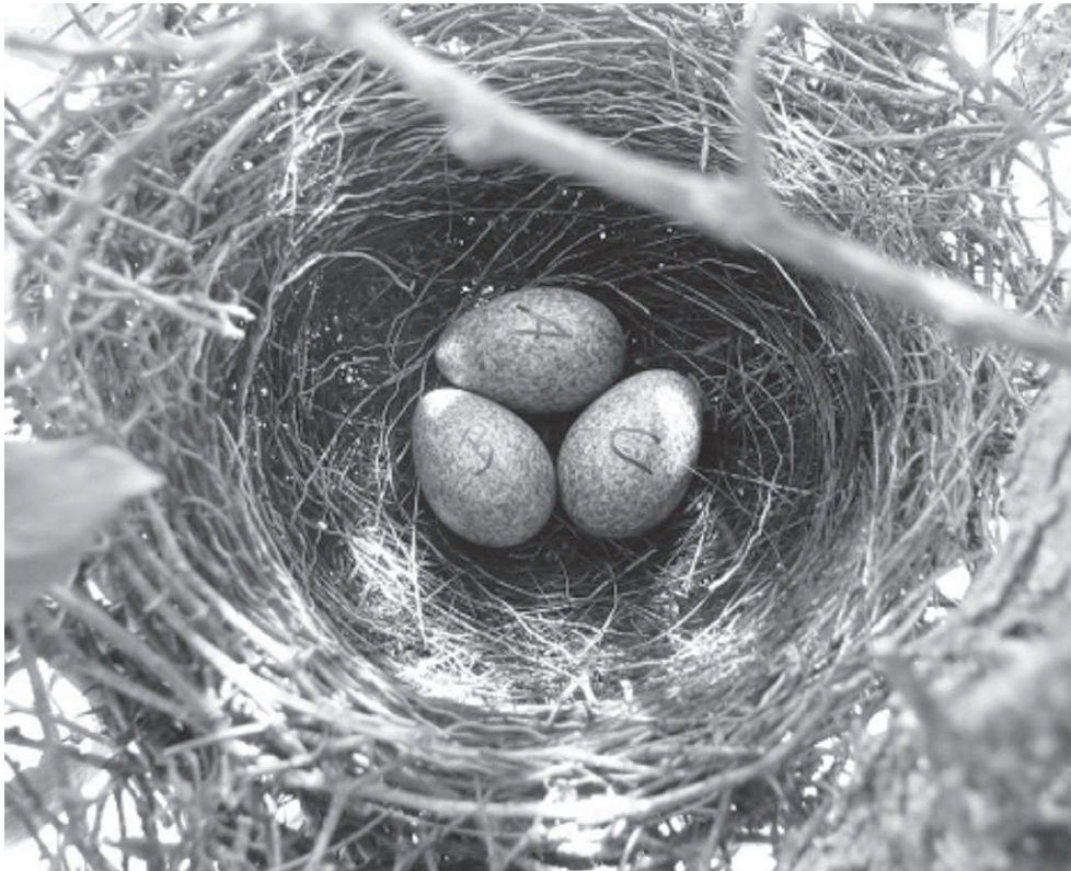
Fig. 5. Nido de Cardenal Común en los talaes de Punta Indio.

Los nidos ubicados sobre coronillo se encontraron a menor distancia de la periferia que los ubicados sobre tala. El hecho de que en coronillo los nidos sean ubicados más cerca del borde de la copa indicaría que la elevada densidad de follaje de esta especie permite el ocultamiento del nido a menor profundidad. También podría existir una desventaja asociada a la ubicación muy alejada del borde relacionada con el acceso de depredadores desde el tronco. Según Murphy, (1983) y Alonso et al. , (1991), los nidos a menor altura y en la zona central de la copa son más visibles y accesibles para los depredadores del suelo, mientras que los nidos más expuestos en la periferia son de fácil acceso para depredadores del aire y también expuestos a las adversidades climáticas. Götmark et al. , (1995) indicaron que existe un balance entre las ventajas de un mayor ocultamiento y la necesidad de mantener la visibilidad para detectar potenciales depredadores, individuos de la propia especie y fuentes de alimento. Wilson y Cooper, (1998) proponen que existe un balance entre la ventaja de evitar depredadores colocando los nidos en la periferia y la desventaja de la exposición a las condiciones climáticas adversas. La localización del nido podría depender de la importancia relativa de