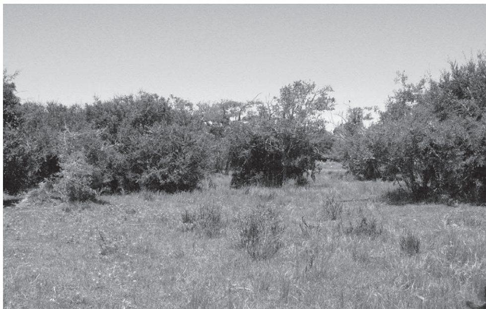
Fig. 4. Bosque abierto de tala y coronillo en el área estudiada.