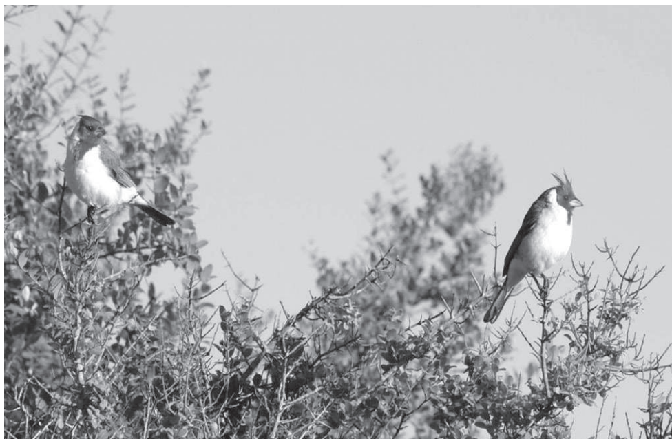
Fig. 6. Pareja de Cardenal Común sobre un tala en el área estudiada.