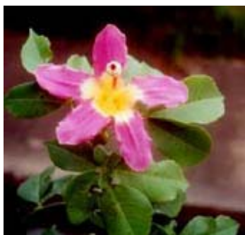
Fig. 6: Flor del Torobochi

En una primaria investigación de campo observamos que la «roseta» bien podría haber abrevado en modelos como la flor de toboroichi ( Chorisia speciosa A. St. Hil.) (fig.6), flor emblemática cuya leyenda cuenta que la Virgen de Cotoca, patrona de la región, apareció en un árbol de toborochi. De color rosa pálido, pasa por varios matices hasta el rosa oscuro 5 y hoy en día tiene un uso ornamental muy difundido en calles, avenidas, plazuelas y otras áreas verdes.