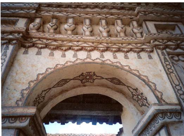
Fig. 10: Arco de la Portada

En el caso del arco que remata la portada principal observamos cómo conviven los ornamentos florales con los geométricos y con elementos del más puro estilo barroco (fig.10).