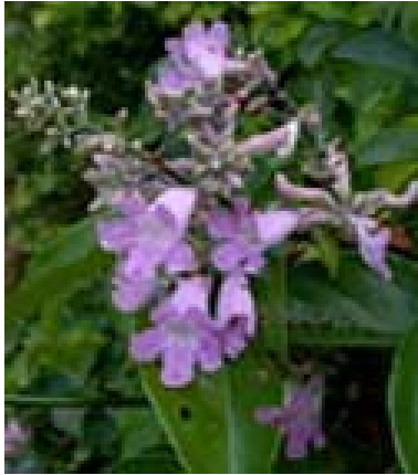
Fig. 8: Flor del Saludo

neros cristianos atribuyeron esa simbología religiosa a cada uno de los órganos de la planta. Para ellos, las hojas eran las lanzas que hirieron el cuerpo de Cristo, los zarcillos eran los látigos que lo flagelaron, la corona con sus rayos les recordaba corona de espinas, los tres carpelos eran los clavos usados en la cruz, las 5 anteras simbolizaban las heridas infligidas y, aún sus diez apóstoles, excluyendo a Pedro y Judas, estaban presentes en forma de cinco sépalos y cinco pétalos. 6