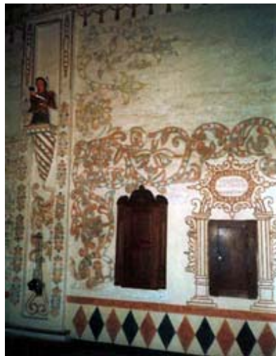
Fig. 13: Muros de la Sacristía

sal hacia la abstracción, incluyendo toda la conciencia estética de una época.» 8 Tenemos uno de los mejores ejemplos en los muros de la Sacristía donde una composición plástica conformada por capullos que se abren y cierran, engarzados en tallos curvos, van orlando las puertecillas y la cartela, coexistiendo con el gran zócalo ajedrezado por rombos alternados, verde y rojizo. Enmarca la composición, columnas decoradas con guirnaldas de flores. (fig.13)