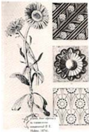
Aster Alpinus . Tratamiento ornamental

Los zarcillos de acanto, invención artística libre, cuyas espirales sirven de base al ornamento del ramaje son ligados orgánicamente a flores o animales y fueron tomados muchas veces de modelos naturales o bien de modelos clásicos del arte, alcanzando su máximo elegancia en el Renacimiento 3 (fig.3)