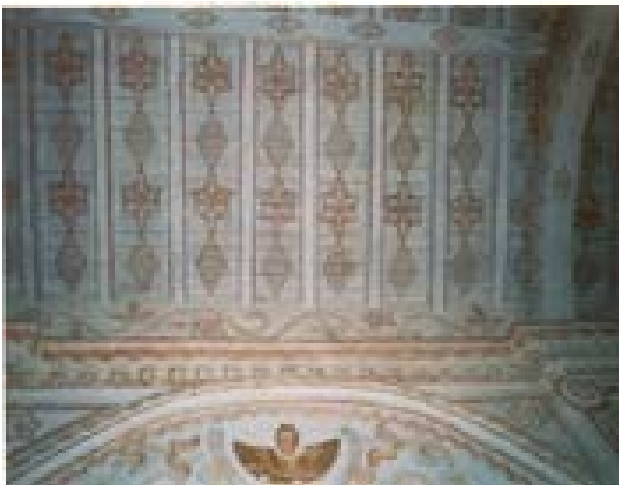
Fig. 9: Cubierta Ornamentada

caracterizándose por su temática con la presencia de elementos de la flora y fauna, tomando su propio camino y alejándose de las influencias del arte europeo. La fragmentación del espacio en composiciones compartimentadas (frisos) y las nuevas soluciones cromáticas, con la predilección por los colores intensos, son otro rasgo típico del naciente estilo pictórico. Éste fue un arte que buscaba imponerse sobre el espectador con la abrumadora presencia de lo ornamental. Hay que imaginarse a los neófitos entrar a la iglesia y experimentar visualmente el «poder» de la nueva fe expresado en esa riqueza pictórica que desde arriba y los costados las asediaba.. La cubierta de armadura de madera a dos vertientes o a dos aguas, se trata de una