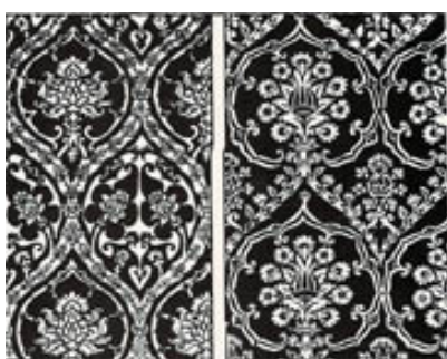
Fig. 11: Muro de la Iglesia - Estampados Orientales

tos botánicos y con el ornato de los muros en general, la flora fue precisamente lo que se impuso. Una de las preguntas que nos hacemos frente al repertorio iconográfico de las pinturas y ornamentos murales en todas las Iglesias de Chiquitos es ¿por qué en este repertorio predominan elementos vegetales, ramas, brotes, flores como si la pretensión fuera la conformación de un jardín mural? El jardín simboliza un espacio utópico e irreal, que representa un marco ajeno a las exigencias del tiempo, espacio utópico de la reflexión mística. Si observamos la decoración de este muro ¿es posible que asociemos la iconografía con estampados de textiles orientales? (fig.11 ).