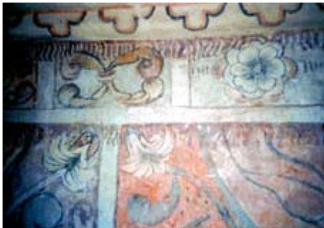
Fig. 5: Friso

A modo de remate superior hallamos un friso (fig.5) compartimentado en rectángulos donde se pueden reconocer flores diversas alternadas en su variación. ¿podrían ser flores locales, es decir del ambiente natural que rodeaba a los indígenas?