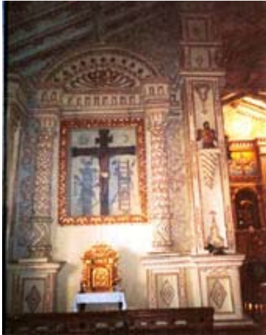
Fig. 14: Calvario

expresa Leach, «los diseños de los pueblos primitivos rara vez son abstractos en sentido genuino» 11 .