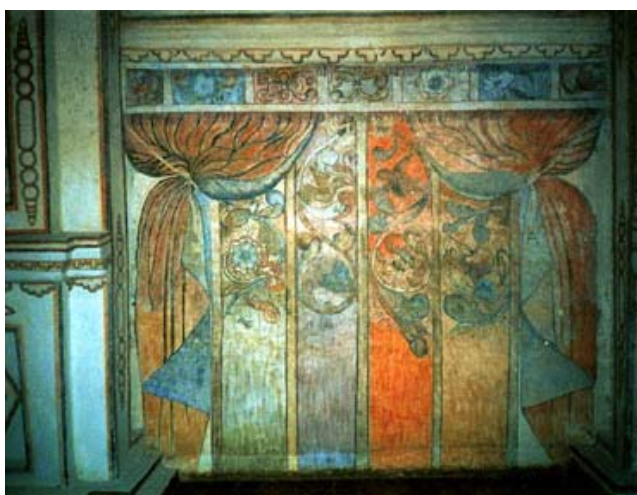
Fig.1 Pintura mural en el Prebisterio

El hombre representó primero a los animales que a las plantas, pero la planta tomó