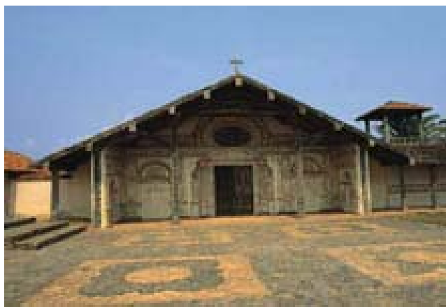
SAN XAVIER. Fachada

La provincia de Chiquitos al este de Bolivia se extiende entre las tierras altas de los Andes y las que son tributarias de los ríos Amazona y Pilcomayo. Al sur limita con la Serranía de Santiago y la Serranía de Chiquitos, al oeste por el río Guapay y las llanuras de Santa Cruz bordeando por el este el río Paraguay y cerrando por el norte con la llanura húmeda de Beni (en la época colonial perteneciente a la Provincia de Moxos).