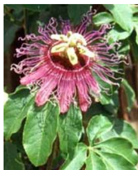
Fig. 7: Flor de la Pasión

La roseta doble podría ser una estilización de la passiflora cincinnata , pachiorsh para los chiquitanos y también llamada flor de la Pasión (fig.7) por los conquistadores de América a mediados del siglo XVI. Su nombre está relacionado con la Pasión y Crucifixión de Cristo, porque los primeros misio-