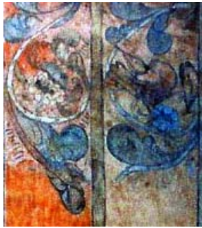
Fig. 3: Zarcillos de Acanto