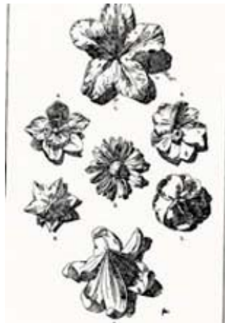
Fig. 4: Rosetas

Las flores que acompañan este conjunto están basadas en la roseta (fig.4) con un desarrollo central de un botón coronado de pétalos e insertada en una base mayor, es decir una roseta doble. Usamos el vocablo «roseta» conforme a la definición de Meyer «se llama roseta a todo conjunto decorativo de forma circular que irradia de un centro». 4