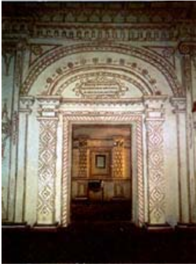
Fig. 12: Portada del Baptisterio