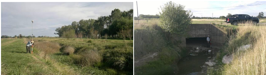
Relevamiento en el canal de descarga y alcantarillas pertenecientes.

Con este esquema natural coexisten obras de canalización que afectan este comportamiento y que se incorporan al sistema. El principal elemento agregado es el canal de descarga que vincula a la laguna con el Canal del Gato, otorgando al sistema una salida externa artificial, con la única regulación producto de las obras existentes en el mismo.