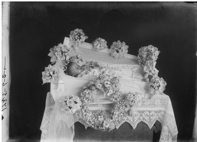
Figura 2: Fotografia Postmortem de Criança, 1911.