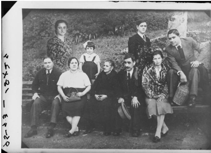
Figura 6. Fotomontagem, S. Paio de Merelim – Braga, 1949, © Museu da Imagem, Arquivo da Fotografia Aliança (Ref. AAL1223)