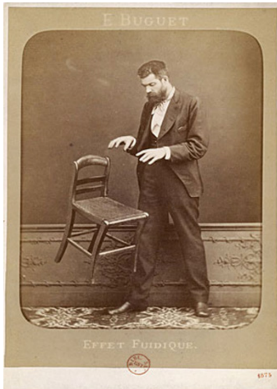
Figura 7. Efeito Fluídico , Edouard Buguet, 1875, The Metropolitan Museum, Wikimedia Commons, Domínio Público