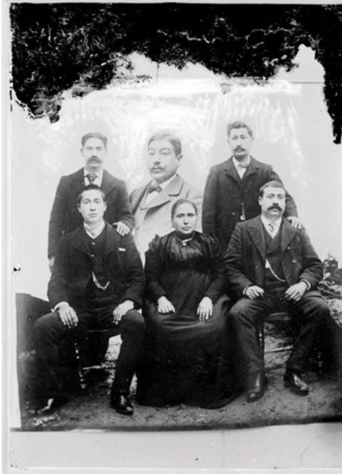
Figura 5: Fotomontagem sobre retrato de família, Início do séc. XX, Local Não identificado, Fotógrafo Desconhecido. © Coleção Fotografia Muralha. Associação para a Defesa do Património de Guimarães