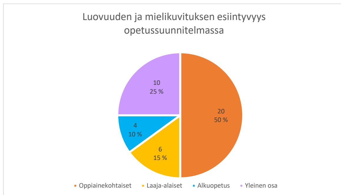
Kuvio 1. Kuvaajassa näkyy luovuuden ja mielikuvituksen esiintyvyydet määrällisesti ja prosentuaalisesti eri opetussuunnitelman osissa.

luokittelu perustunut tähän. Joissakin, mutta harvoissa tapauksissa, olen itse tulkinnut sen, mikä konteksti on. Tällöin olen määritellyt työtavaksi sellaisen kontekstin, jossa luovuus tai mielikuvitus on selkeästi liitetty tekemiseen, tekemisen muotoon tai osaksi sitä ja yksilökeskeisesti. Toimintatavaksi olen tulkinnut kohdat, joissa vuorovaikutus on osana kokonaisvaltaista toimintaa, joka myös käsittää laajempia aihealueita. Ajattelu on luokkana muotoutunut niistä konteksteista, joissa luovuus ja mielikuvitus esiintyvät eritavoin oppilaan käsittämiseen tai ymmärrykseen, jollakin tavalla henkiseen kasvuun liittyen. Vaikka luovuus ja mielikuvitus ovat ajattelua ja ajattelukykyä, silti konteksti on liittännyt luovuuden ja mielikuvituksen henkisen kasvun sijaan enemmän käyttäytymismalleihin tai itse tekemiseen. On siis huomattavaa, että luovuus ja mielikuvitus ovat joka tapauksessa aina jollakin tavalla osana oppilaan henkistä kasvua, siis ajattelukykyä.