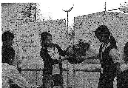
図3 世界を意識させる講義・演習

インタビューをお願いした方の助言を得ながら行うなど、話を英語で聞くだけではないような活動とした。