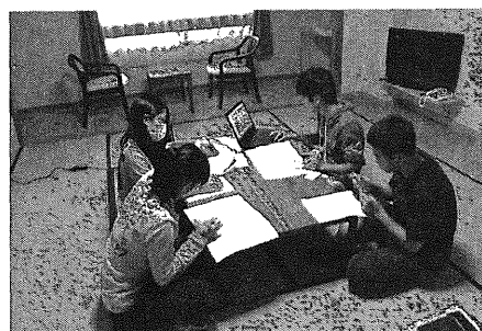
図5 インタビューのまとめ作業