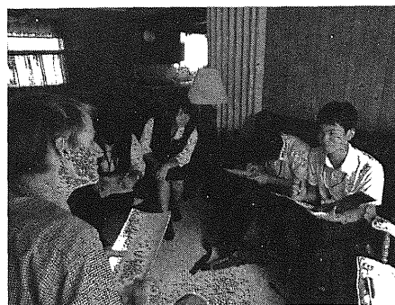
図4 インタビューの様子

インタビューをお願いした方の助言を得ながら行うなど、話を英語で聞くだけではないような活動とした。