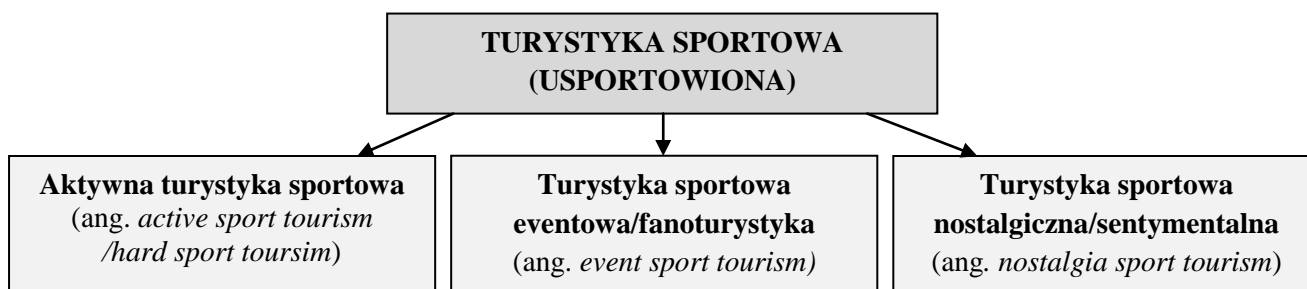
Rys. 1. Rodzaje turystyki sportowej (usportowionej)

I tak, wyróżniane są następujące formy turystyki sportowej: aktywna turystyka sportowa (turystyka sportowa sensu stricto , ang. hard sport tourism ), turystyka sportowa eventowa/fanoturystyka (wyjazdy na wydarzenia/widowiska sportowe) oraz turystyka sportowa nostalgiczna/sentymentalna (odwiedzanie atrakcji związanych ze sportem – m.in. stadiony, miejsca olimpiad, muzea sportowe itp.) (Gibson 1998, s. 45) (rys.1).