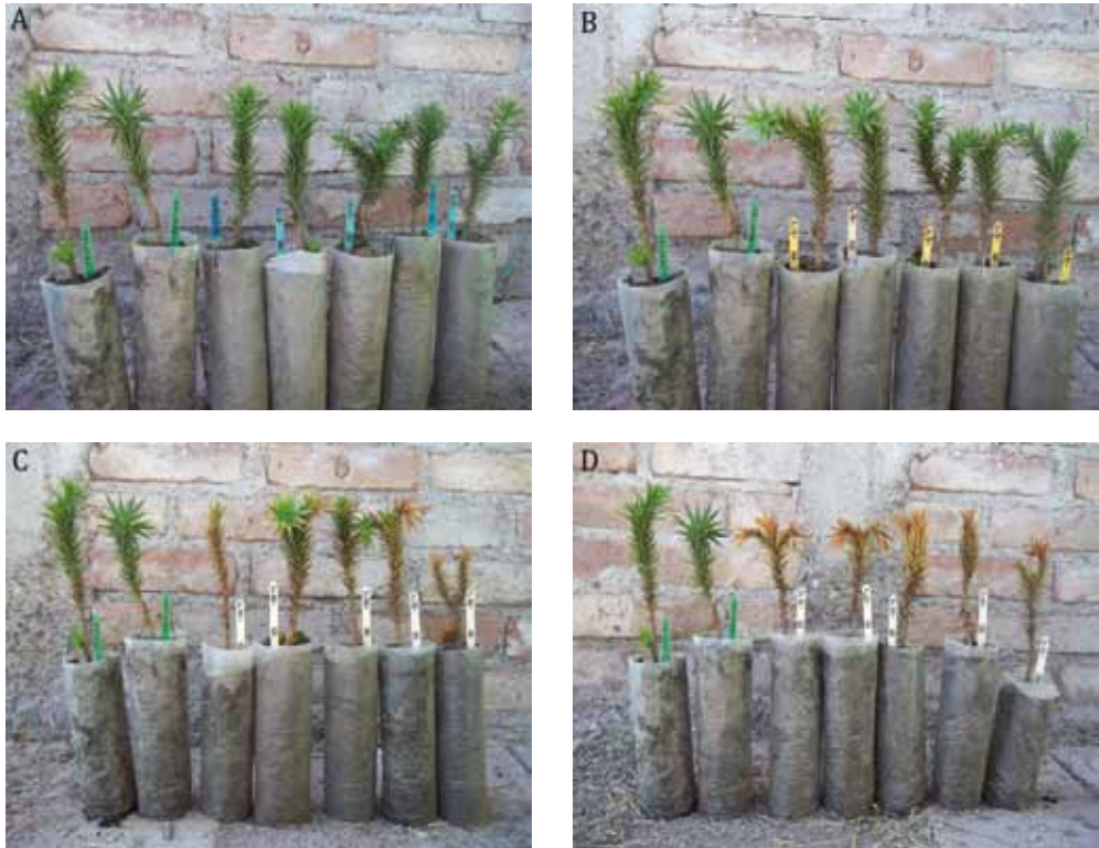
Foto 1. Plantines de Araucaria araucana con diferentes respuestas a distintos niveles de temperaturas de congelamiento. A) tratamiento -2^{\circ}\text{C} ; B) tratamiento -6^{\circ}\text{C} ; C) tratamiento -10^{\circ}\text{C} y D) tratamiento -15^{\circ}\text{C} . En todos los casos, los dos plantines de la izquierda corresponden al control.

Photo 1. Responses of Araucaria araucana seedlings under different levels of freezing temperatures. A) treatment at -2^{\circ}\text{C} ; B) treatment at -6^{\circ}\text{C} ; C) treatment at -10^{\circ}\text{C} and D) treatment at -15^{\circ}\text{C} . In all cases, the two seedlings on the left correspond to the control.