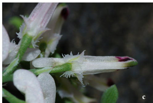
Figura 1. Fumaria munbyi Boiss. & Reut., Isla Negra, San Juan de los Terreros, Almería, España, (Fotografía D. Pavon 30.IV.2015). a, hábito; b, inflorescencia y frutos; c, flor mostrando los sépalos. Fumaria munbyi Boiss. & Reut., Spain, Almeria, Isla Negra (Photograph D. Pavon 30.IV.2015). a, habit; b, inflorescence and fruits; c, flower showing sepals.

inciso-dentados y grandes flores (12-15 mm) blancas (ligeramente rojizas después de la fecundación) con ápices purpúreos; y sus frutos esféricos y débilmente rugosos una vez secos. Se trata un taxón poliploide (10x, 2n=80) cuya