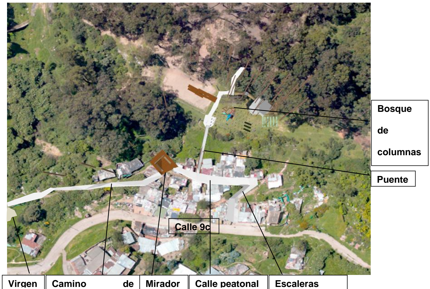
Figura 7. San Bruno. Fuente: elaboración propia. 2016 Licencia CC BY-NC-ND 2.5

Además, este elemento servirá como pauta para visitantes y residentes; es decir, es un espacio donde se termina el primer tramo del sendero y empieza el sector de las