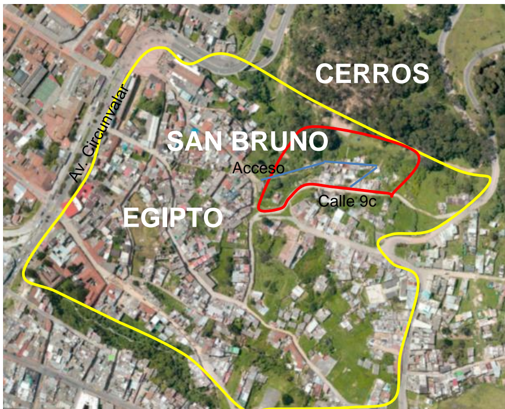
Figura 4. Sector San Bruno. Intervención sobre foto.

Entrando en detalles y como premisa importante para este documento, en lo que concierne para el barrio Egipto, o como otras personas llaman San Francisco Rural, se plantea que el sector de San Bruno sea un ente moderador entre la ciudad consolidada y la reserva natural, mediante una transición progresiva de elementos urbanos que permitan la interacción de las personas con el medio natural, de manera respetuosa.