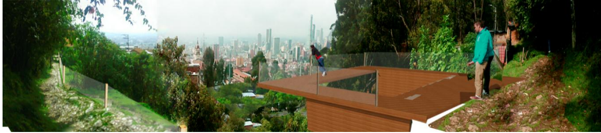
Figura 6. Mirador. Fuente: elaboración propia. 2016. Licencia CC BY-NC-ND 2.5

Este camino cuenta con unas vistas completas hacia la ciudad, como se ve en la figura 6, porque es un lugar que se separa del barrio consolidado, y viajando hacia los cerros permite expandir la vista hacia el occidente, donde aparece la ciudad casi en totalidad como un cuadro que la comunidad tiene a disposición diariamente.