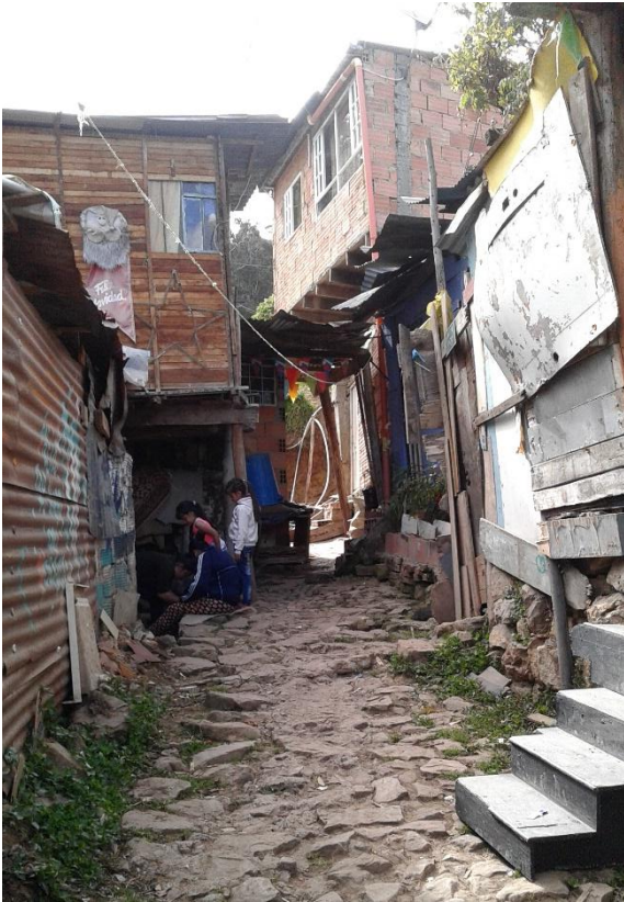
Figura 8. Calle San Bruno. 2016 Licencia CC BY-NC-ND 2.5

Este segundo tramo se extiende desde el mirador hasta la entrada oriental al barrio por la calle 9c. Este tramo afectará directamente las viviendas, dado que son los andenes y espacio público que da acceso a ellas.