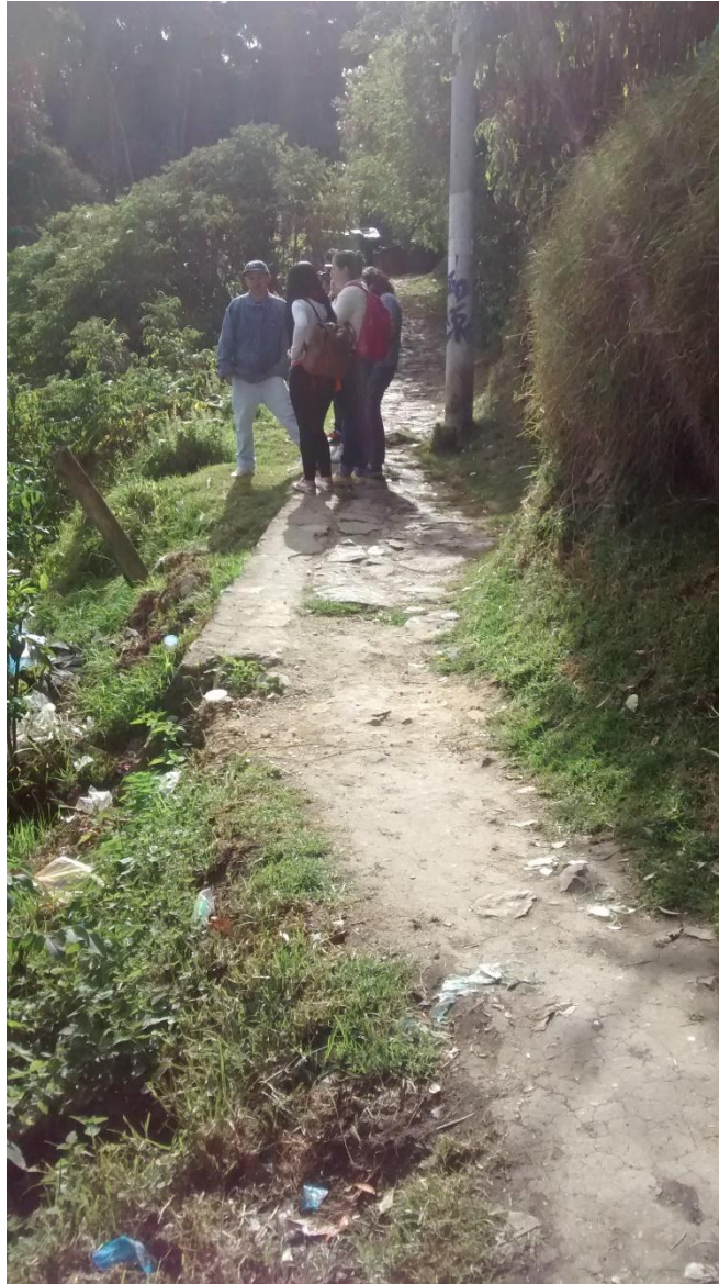
Figura2. Camino a San Bruno. Fuente: elaboración propia.2016 Licencia CC BY-NC-ND 2.5

Es contradictorio encontrar dichas necesidades en un barrio que queda a 10 minutos caminando de la plaza de Bolívar, donde se encuentra el Palacio de Nariño, la alcaldía de Bogotá y otras importantes entidades estatales. Las consecuencias de un capitalismo mal organizado, desigual y corrupto, salen a flote en cada barrio o sector en donde el estado simplemente le da la espalda, en este caso puntual, pareciera