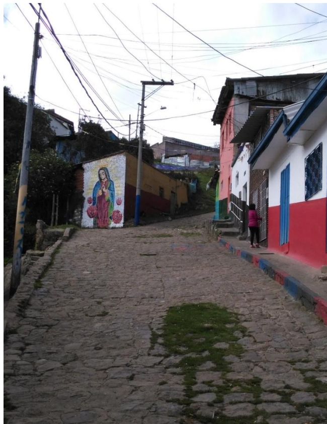
Figura 5. Virgen Fuente: elaboración propia.2016. Licencia CC BY-NC-ND 2.5

En las visitas hechas al barrio, se denotaron varios lugares emblemáticos para la comunidad por diferentes actividades que se realizan allí, o la mayoría de los casos, lugares en donde cayeron familiares o amigos por el conflicto armado que hay entre barrios. Uno de ellos es una culata de una casa, como se ve en la Figura 5, que está terminando la principal calle de este sector, esta casa sirve como remate de la calle vehicular y el comienzo del camino a San Bruno, dado que a este lugar no se puede acceder vehicularmente.