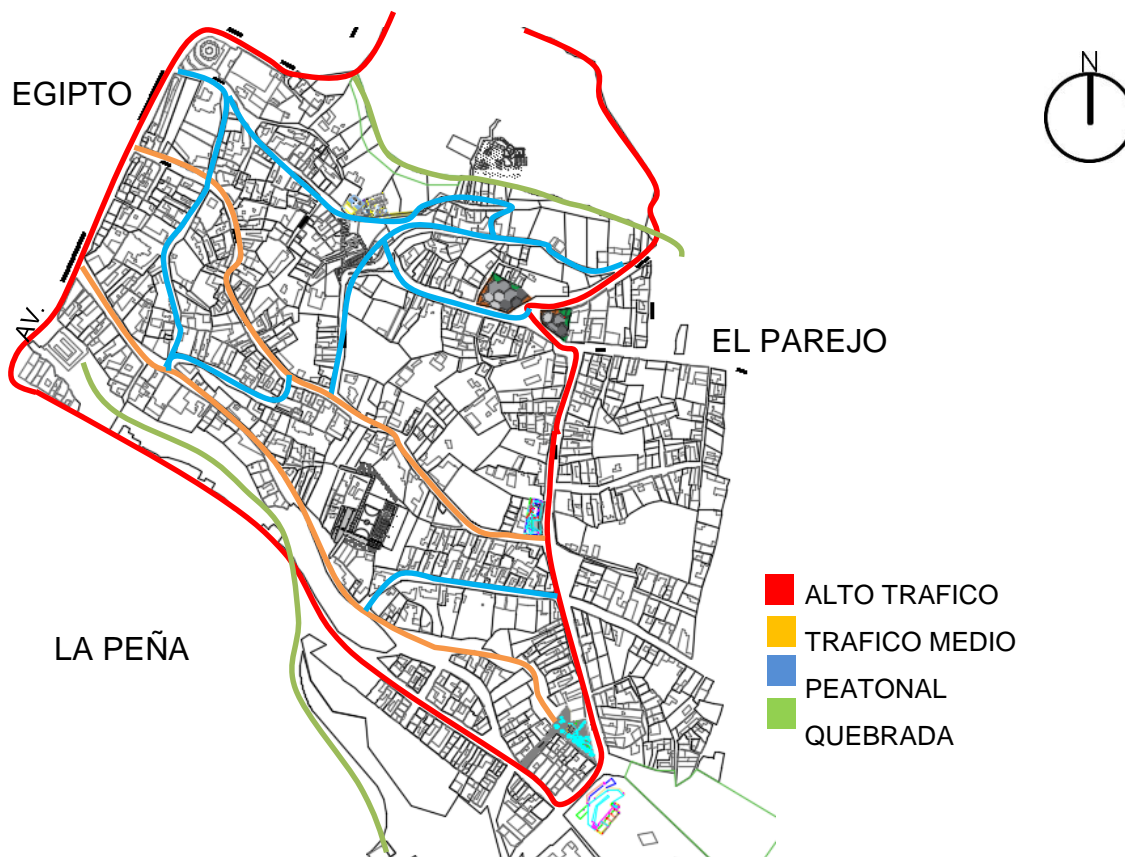
Figura3. Tres Barrios. Fuente: elaboración propia.2016 Licencia CC BY-NC-ND 2.5

Esta red está compuesta por los dispositivos y por una serie de estrategias puntuales, para conectarlos. Propuestas que buscan que los tres barrios se vean beneficiados a nivel general, no solo los vecinos de los proyectos, como se ve en la figura 3.