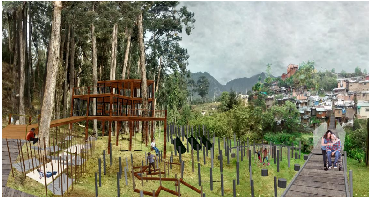
Figura 11. Bosque de Columnas. Fuente: elaboración propia. 2016 Licencia CC BY-NC-ND 2.5

columnas como ausencia de las mismas. Todas las actividades físicamente tienen elementos verticales de diferentes maneras para generar diferentes espacialidades. Igualmente algunos de estos elementos verticales sirven como luminarias, bancas, basuras, entre otros como se ve en la figura 11.