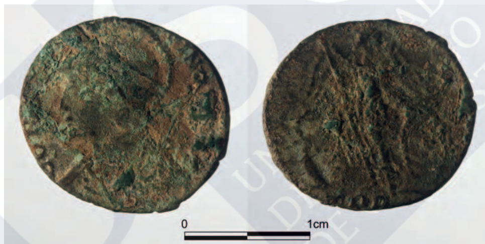
Figura 2. Follis conmemorativo de la fundación de Constantinopla acuñado en Tréveris.

Referencia bibliográfica: RIC VIII , pp.34 y 142-43.