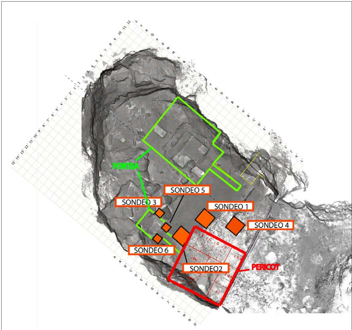
Fig. 2: Planta de la cavidad con indicación de los sectores excavados según las diferentes intervenciones efectuadas hasta la fecha. En rojo, intervenciones de L. Pericot; en verde, trabajos de Javier Fortea; en naranja excavaciones actuales.

se han rebajado UUEE de un máximo de 5 cm, consignándose toda la información en las correspondientes fichas, toda vez que los materiales relevantes han sido registrados mediante coordenadas tridimensionales con el apoyo de una estación total Leica TCR-705. Estas coordenadas tridimensionales son descargadas en el laboratorio e incorporadas a las fichas de registro digitales.