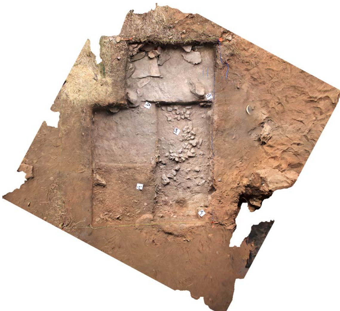
Fig. 3. Fotogrametría efectuada en el sondeo 4 al final de la intervención de 2016.