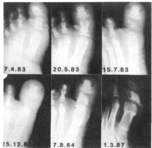
Figura nº 1: Destrucción progresiva de la falange proximal y reconstrucción ósea parcial posterior.

Fue tratada mediante reposo en cama, elevación del miembro afecto y antiinflamatorios no esteroideos. A los siete días de tratamiento la situación clínica había mejorado notablemente y tras hemocultivos seriados negativos fue dada de alta hospitalaria.