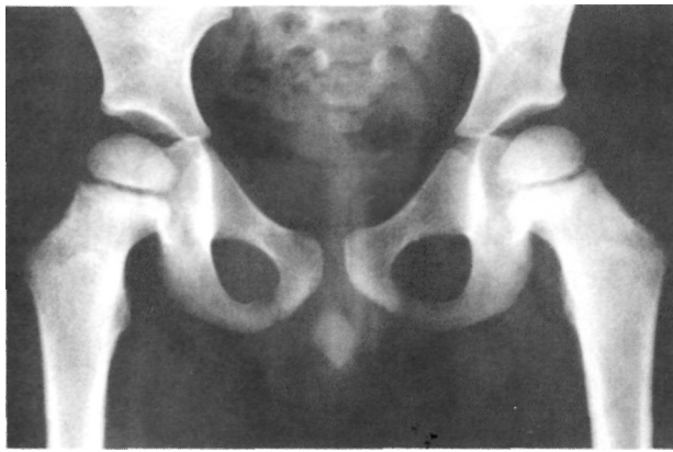
Figura nº 2. Rx tras la reducción de la luxación.