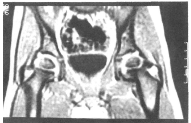
Figura nº 5. Resonancia Magnética realizada a los 18 meses de la lesión.