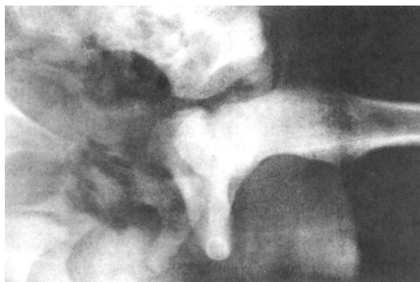
Figura nº 1. Rx del paciente al ingreso.

La radiografía mostró luxación anterior de cadera izquierda (Figura nº 1), procediendo bajo anestesia general, a reducción a cielo cerrado (Figura nº 2) y confirmando la ausencia de partes blandas interpuestas y fractura osteocondral mediante ecografía (Figura nº 3) y TAC (Figura nº 4) respectivamente. La cadera afecta se mantuvo en extensión continua mediante tracción blanda durante cuatro semanas. Posteriormente se mantuvo al paciente cuatro semanas más en descarga permitiéndole al final de los cuales el apoyo progresivo del miembro inferior izquierdo. El ejercicio físico se autorizó a los seis meses del traumatismo.