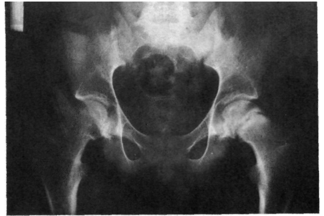
Figura nº 3. Radiografías anteroposterior y Lowenstein que muestra una epifisiolisis femoral bilateral, estando el cartílago fusionado en la cadera derecha.