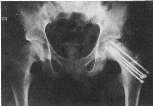
Figura nº 5. Radiografía tras el tratamiento con cuatro clavos de Knowles.