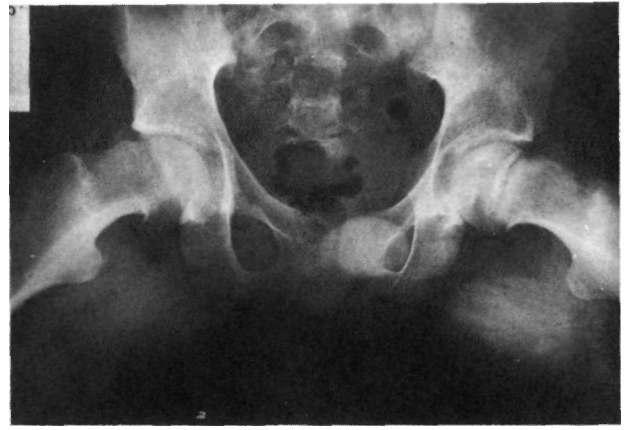
Figura nº 4. Radiografía en proyección de Lowenstein.