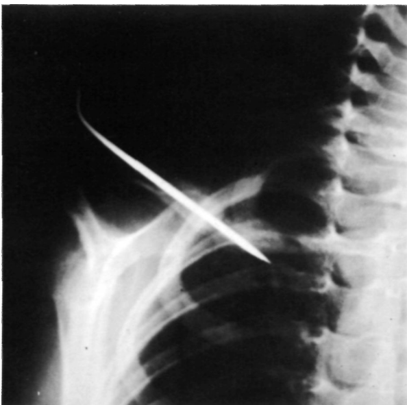
Figura 2. Control radiológico postoperatorio: Síntesis con aguja de Kirschner y decorticación.

Seis semanas después, se retiró el vendaje y se extrajo la aguja objetivándose radiográficamente la consolidación