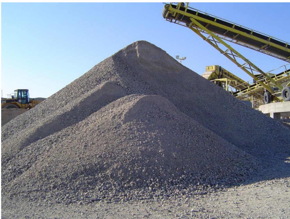
Figura 1. Áridos reciclados de RCD

(del año 2002). El valor del coeficiente de Los Ángeles es del 30%. Este valor no cumple los requisitos de tráfico pesado establecidos en el PG-3 (del año 2002) para tráfico pesado T00 y T0 en capas de base. Por otra parte, el coeficiente de absorción del AR (grueso) es 4,86%, un valor muy superior al ofrecido por los AN.