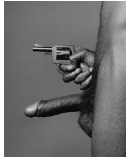
Cock and Gun (Mapplethorpe, 1982).

Negro el tono de su piel, / de sus ojos el color / y negro también el pelo de mi amor. Negro, precioso color / de escuchar en una voz, / es negro profundo el eco del amor. Desde lejos negro, / desde cerca negro, / negro monocromo. El negro es hoy mi color / y negros son ya mis días, / la alegría, el amor. Negro el tono de su piel, / de sus ojos el color / y negro también el pelo de mi amor. Cuando se piensa algo bello, / la boca se abre sola y exclama: / «¡Negro!» Todo negro puro / como el café oscuro, / negro mi futuro. Todo es alegría alrededor / y negros los mediodías, / la poesía, el amor. (Single – Oda a los negros)