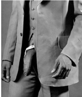
Man in Polyester Suit (Mapplethorpe, 1980).