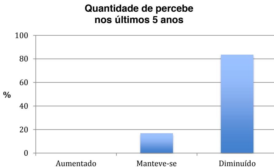
Figura 4. Frequência relativa de respostas à questão “Na sua opinião, a quantidade de percebe nos últimos cinco anos tem aumentado, manteve-se ou diminuído?”. N=12.

De acordo com a larga maioria dos apanhadores, a quantidade (Figura 4) e o tamanho (Figura 5) do percebe tem diminuído nos últimos cinco anos.