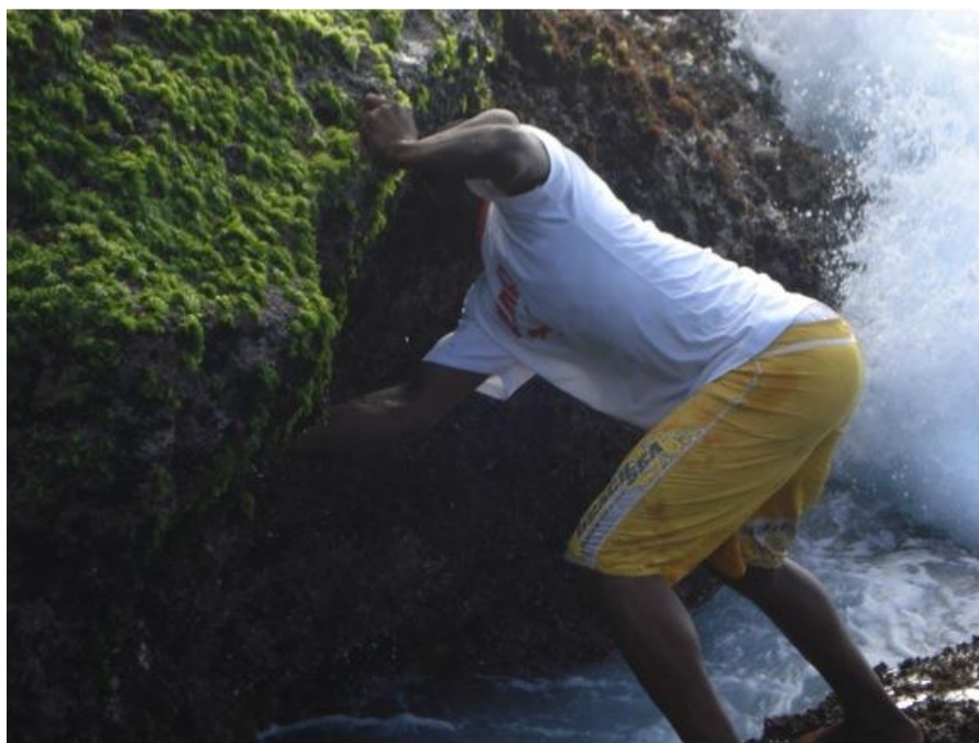
Figura 2. Apanha de percebe no Tarrafal, Santiago, Cabo Verde.

Todas as espécies de Pollicipes são comestíveis e exploradas com maior ou menor intensidade, sendo que P. pollicipes pode ser considerado o recurso económico mais importante da zona intertidal de litorais rochosos do Norte de Espanha e de Portugal continental (ex.: Molares e Freire, 2003; Sousa et al. , 2013). Em Portugal e Espanha, o valor económico desta espécie pode variar entre 20 e 200 euros por kg em restaurantes. Em Cabo Verde, os percebes são também um recurso explorado (Figura 2) e bastante apreciado.