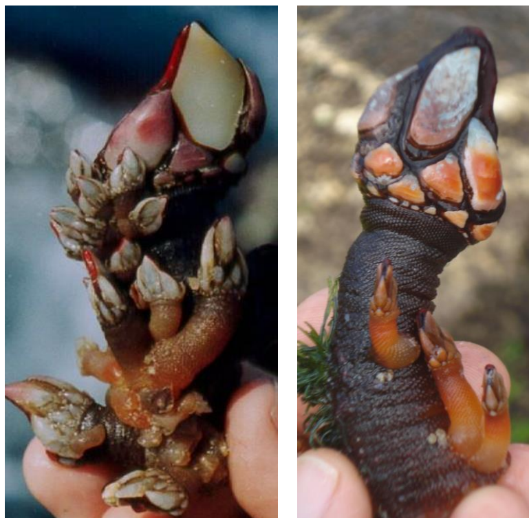
Figura 1. O percebe Pollicipes pollicipes (à esquerda) e Pollicipes caboverdensis (à direita).

Esta espécie nova foi depois descrita do ponto de vista morfológico e genético por Fernandes et al. (2010) tendo sido designada como P. caboverdensis (Figura 1), espécie endémica de Cabo Verde. Posteriormente, a morfologia e genética desta espécie foi também descrita por Quinteiro et al. (2011) e designada como P. darwini . No entanto, segundo as regras do ICZN ( International Code of Zoological Nomenclature ) deve ser utilizada a designação que foi publicada em primeiro lugar, isto é, P. caboverdensis .