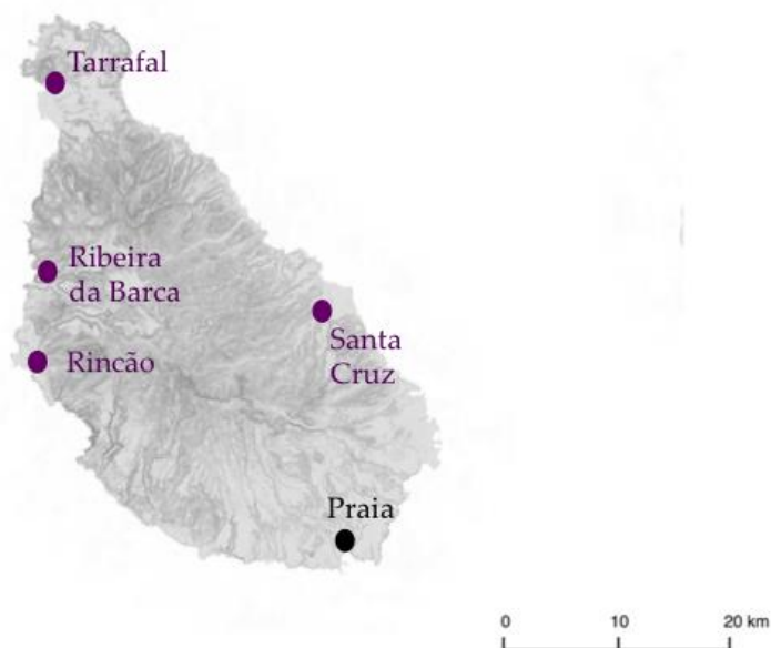
Figura 3. Mapa da ilha de Santiago, Cabo Verde, com referência à capital de Cabo Verde (Praia) e às localidades onde foram realizados os inquéritos (a roxo).

Foi estabelecido um contacto inicial com a Cooperativa de Pescadores, Peixeiras e Armadores da Região Santiago Norte, tendo depois sido contactados telefonicamente várias associações de pescadores e grupos de pescadores de diferentes localidades, de forma a marcar as respetivas entrevistas. Foram entrevistados 12 pescadores do sexo masculino das seguintes localidades: Tarrafal (n=4), Ribeira da Barca (n=2), Rincão (n=3) e Santa Cruz (n=3) (Figura 3). Os inquéritos foram realizados em junho de 2014.