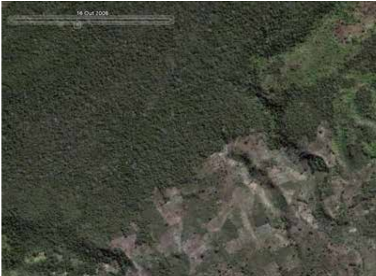
Figura 1. Floresta densa com pressão da agricultura itinerante (2008) no distrito de Covalima, subdistrito de Zumalai

do Segundo Projeto de Desenvolvimento Rural para Timor-Leste e desenvolvido pela Universidade de Trás-os-Montes e Alto Douro (Portugal), cerca de 66% das parcelas da amostragem demonstram a evidência de corte das florestas, cerca de 23% das parcelas da amostragem possuem agricultura itinerante e 19% apresentam sinais de queimadas. A Figura 1 mostra floresta densa no distrito de Covalima com penetração da agricultura itinerante através do canto inferior direito.