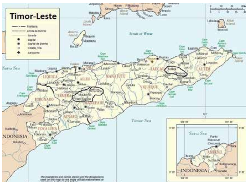
Mapa 1. Timor-Leste

Timor-Leste ocupa uma área de aproximadamente 18.000 km 2 na metade oriental da ilha de Timor situada ao norte da Austrália, no extremo do Sudeste Asiático (Mapa 1). Fazem parte do território o enclave de Oecusse, situado na parte ocidental da ilha, a ilha de Ataúro, situada a 30 km ao norte de Díli e o ilhéu de Jaco, na extremidade leste da ilha. Timor Leste é um dos mais novos países do mundo (2002) e possui uma população de cerca de 1 milhão de habitantes. Timor-Leste é dividido em treze distritos administrativos divididos em 65 subdistritos que por sua vez são subdivididos em 442 sucos e 2336 aldeias.