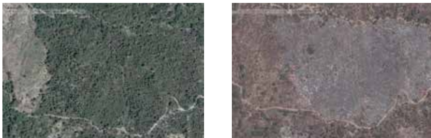
Figura 2. Vegetação antes (2004) e depois da derrubada da floresta (2006) para agricultura itinerante no subdistrito de Atabae, distrito de Bobonaro