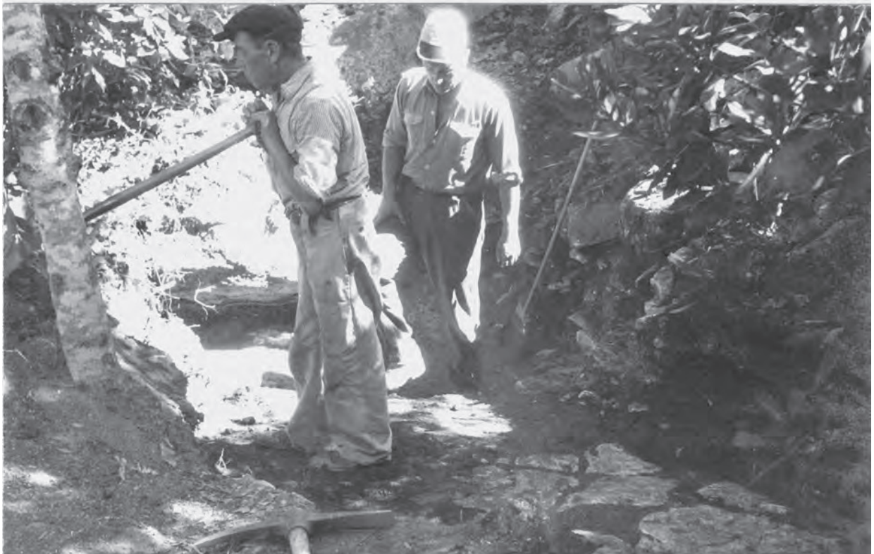
Fig. 2 – Em cima: vista parcial da Casa 2, observando-se o contorno circular das suas paredes, executadas com ortóstatos de calcário, apoiados a penedos graníticos e definindo ao centro uma entrada, em corredor, comunicando no exterior para uma espaço lajeado a céu aberto. Foto tirada na campanha de 1957. Em baixo: vista parcial do lajeado existente no exterior da Casa 2, posto parcialmente a descoberto na campanha de 1957 e alargado na campanha de 1958, a que respeita a presente foto, inédita. Em segundo plano, O. da Veiga Ferreira.