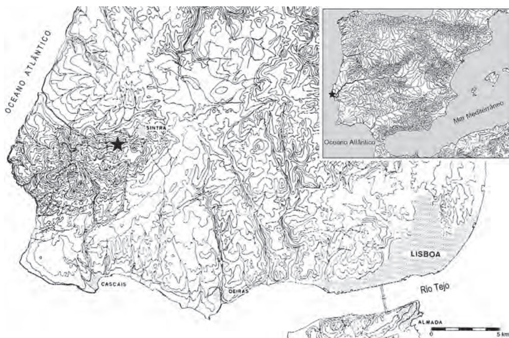
Fig. 1 – Localização da estação da Penha Verde na Península Ibérica e na baixa Península de Lisboa.