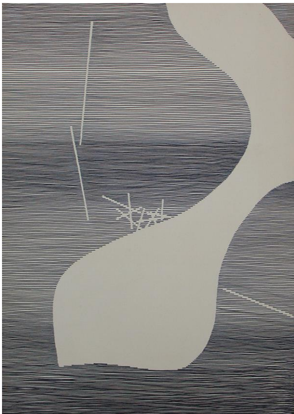
Michel Seuphor, Espace envahi (1952)

Volgens het kaartenbestand van de verzamelaars (Archief SJLP) schonk Luc Peire Seuphor vijf werken (waaronder het werk Vertical ). Een dankbetoon voor Seuphors teksten waarin de sterke waardering voor zijn werk opklonk. Van Seuphor bezat Luc Peire zelf twee werken op papier: Espace envahi (12.1952, chinese inkt, 52,2 x 37,5 cm) en Constellation du danseur I (09.12.1956, chinese inkt, 54 x 30,5 cm).