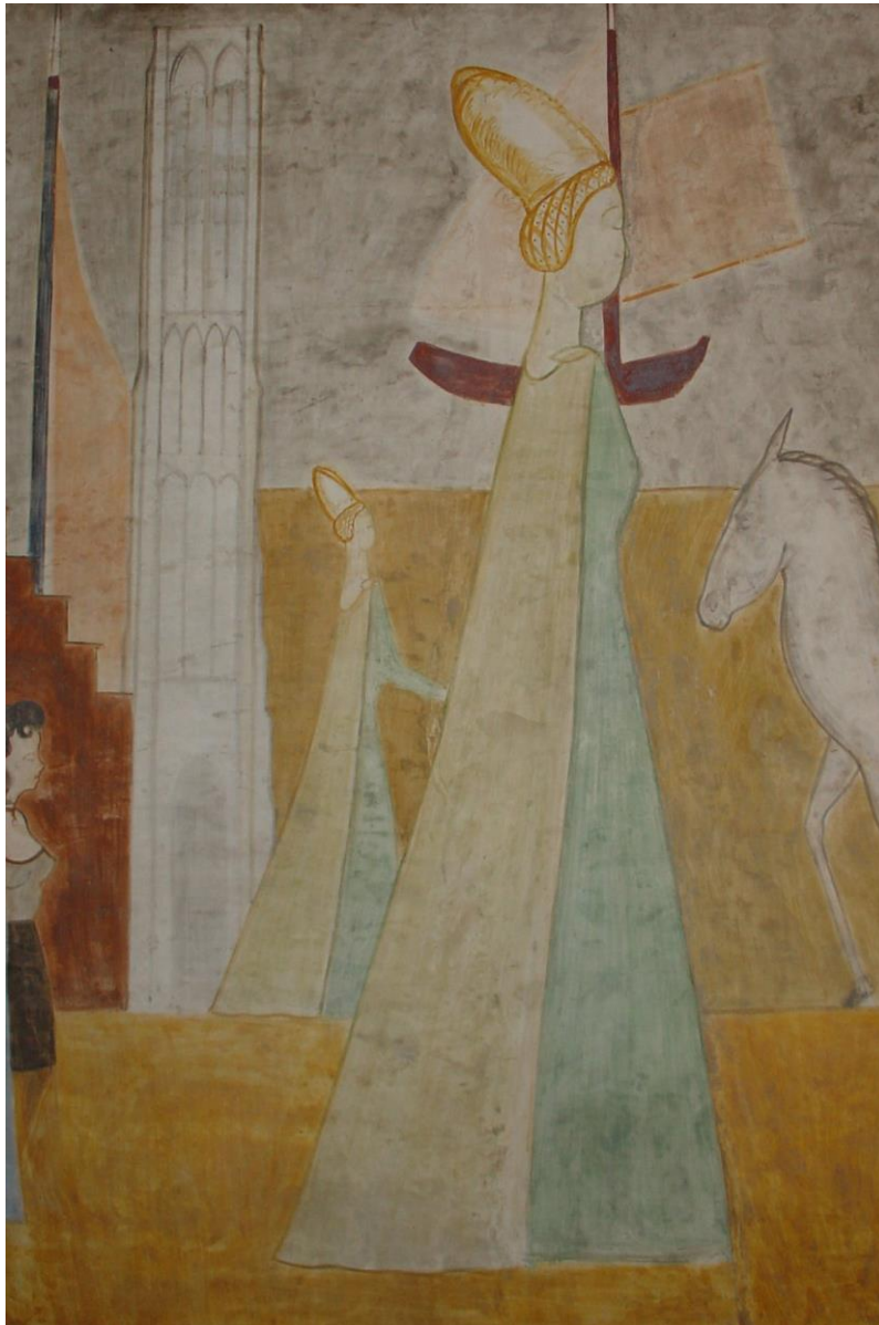
Luc Peire, detail uit Evocatie van Vlaanderen (fresco, 189 x 443 cm, privéwoning Sint-Kruis)

Niet alleen binnen het oeuvre van de kunstenaar maar ook in het genre repertoire van de moderne kunst in Vlaanderen bekleden deze werken in zuivere 'al fresco'-techniek een unieke plaats.