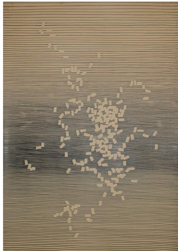
Michel Seuphor, Constellation du danseur I (1956)