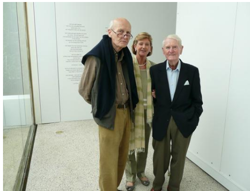
25 juni 2011. Knokke. Tuinkamer met Environnement I van Luc Peire.