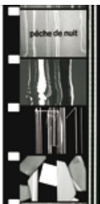
Pêche de Nuit (1963). Fotogram van Jean Mil

The Making of Environnement I (slideshow Jean Mil, 1967/2007)