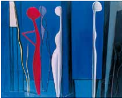
Luc Peire. La Figure rouge (1954, olieverf op doek, 81 x 100 cm, CR 599)

werd hij eensklaps de belangrijkste experimentele romanschrijver van Vlaanderen. En dat was wellicht ondenkbaar geweest zonder de invloed van de moderne schilderkunst, van onder anderen Luc Peire, met wie hij zich zeker sterk verwant voelde op basis van een quasi parallelle geleidelijke zoektocht naar experiment en vernieuwing. 6