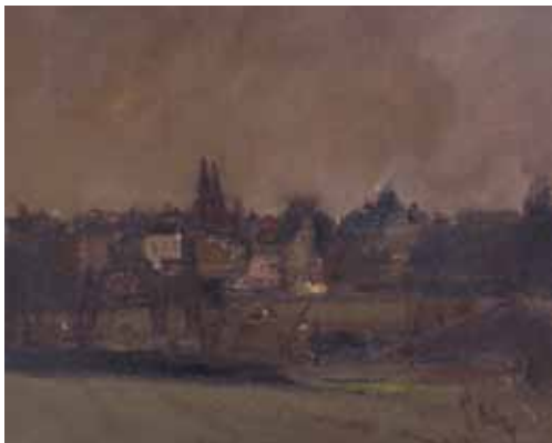
CR 156 Temps orageux