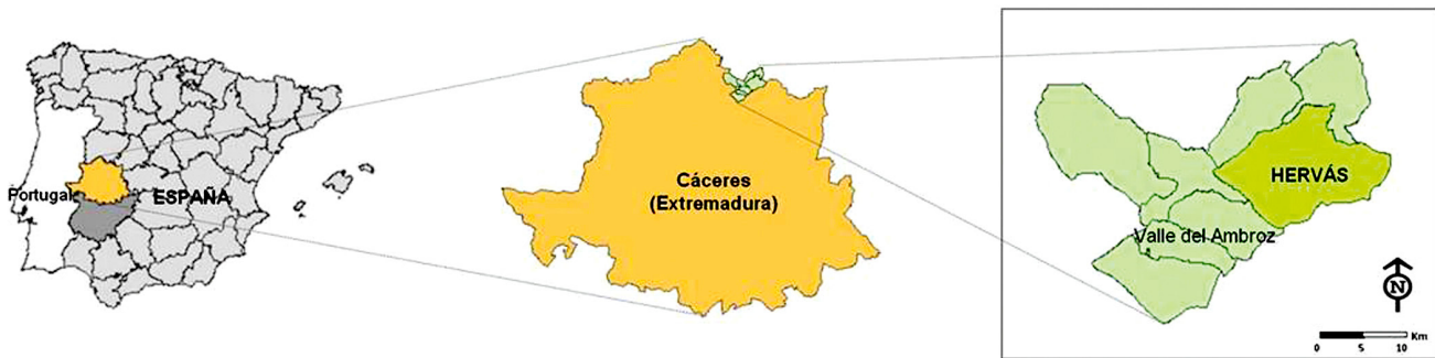
Figura 1. Mapa de situación del área de estudio Hervás.