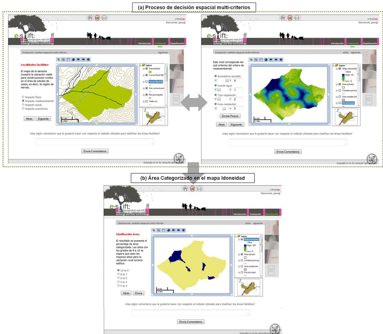
Figura 4. Selección de páginas web que muestran el proceso de toma de decisión espacial multi-criterio.

de los recursos turísticos. Para mostrar la aplicabilidad de este modelo, se ha desarrollado un caso práctico, utilizando el área de Hervás (Extremadura, España) como ejemplo. Particularmente, el caso de estudio ha presentado una aproximación de los procedimientos de agrupación mediante PAJ/PAS para generar un amplio rango de decisiones alternativas para abordar la problemática de la integración de edificaciones rurales con fines turísticos. A través del modelo web propuesto, los usuarios son capaces de aprender de forma interactiva e iterativa sobre la naturaleza del problema y además permite al usuario establecer sus preferencias para la solución deseada. El mapa de conocimiento generado, apoya y estimula el intercambio de opiniones y, por lo tanto, la discusión de intereses propios de cada usuario. Así, estos resultados preliminares muestran la flexibilidad del marco metodológico implementado en el modelo web, e-shift , más allá de la evaluación de todos los posibles criterios y sub-criterios.